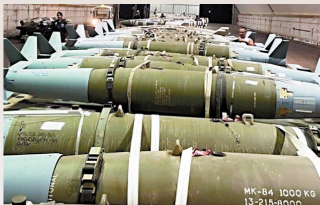
●凱利指以使用美製MK-84炸彈殺死納斯魯拉。

美國國防部稱，美軍已準備好增強針對中東地區的軍力部署，將維持當前的海上打擊力量，並可能增強空中打擊力量，應對伊朗等方面可能針對美軍的襲擊。