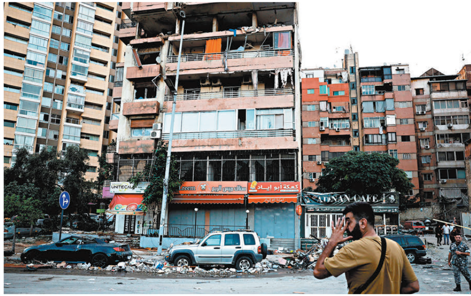
▲貝魯特中部科拉有建築物被擊中受損。