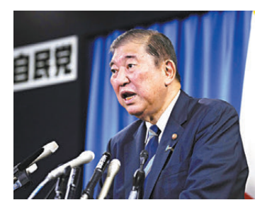
●石破茂乘勢提早大選 保住國會控制權。