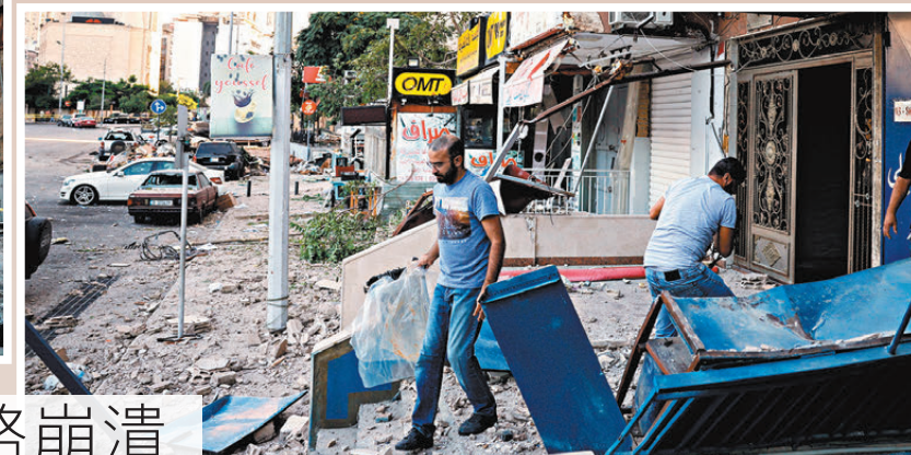
●民眾清理被以擊中受損的商店瓦礫。