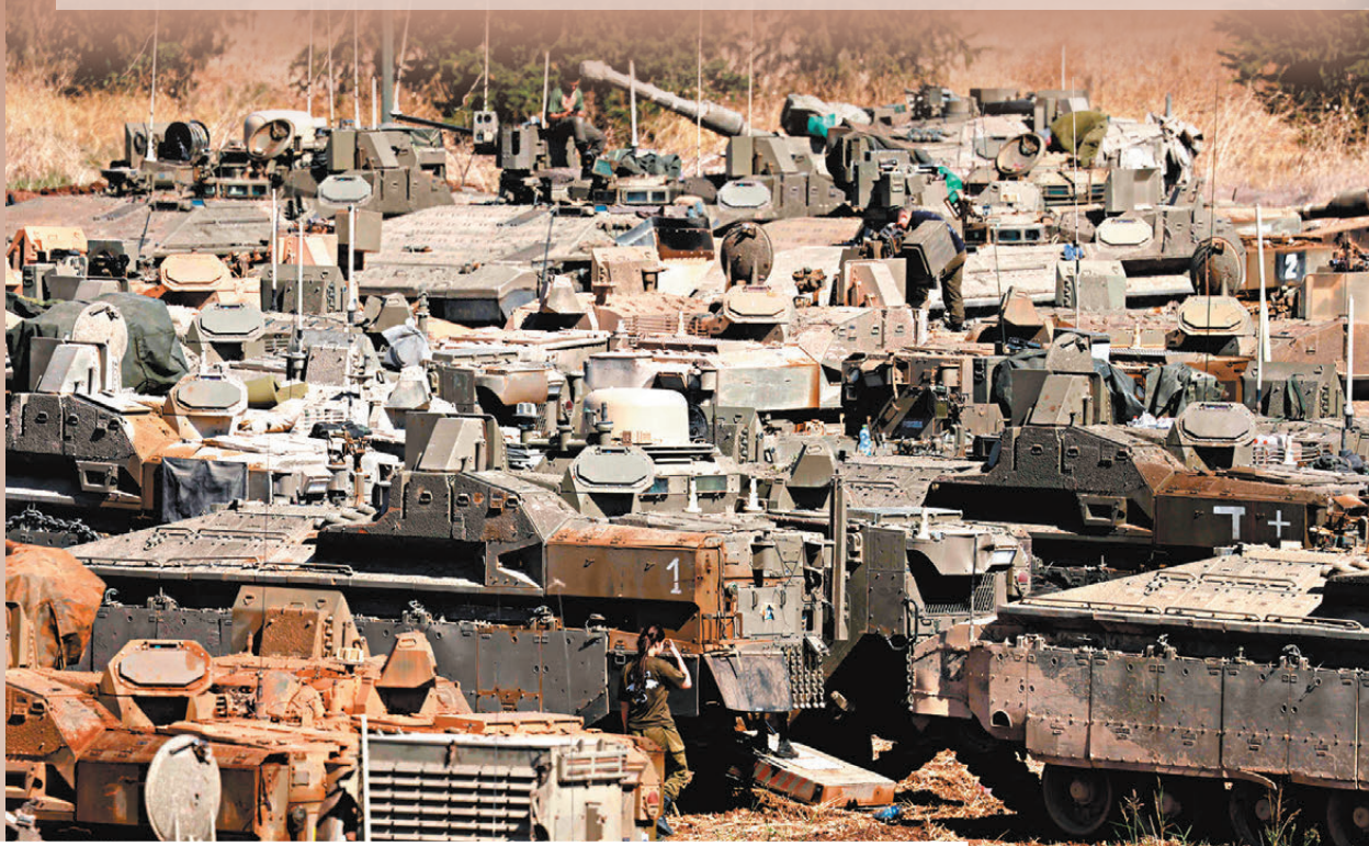
▲大批以軍坦克和裝甲車部署在北部靠近黎邊境。