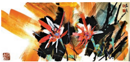
●新概念的荷花 作者供圖

對生活的熱愛、對自然的敬畏以及對藝術的執著追求。荷花在畫家的筆下, 可能成為一種象徵, 代表著純潔、寧靜、堅韌; 也可能成為一種情感的寄託, 傳達著喜悅、憂傷、沉思。觀賞這樣的畫作, 觀者不再僅僅是看到了荷花的形象, 更是走進了畫家的內心世界, 與之產生共鳴和對話。新概念的荷花繪畫, 也可以拓展和改變觀賞者的審美觀念。它讓大家明白, 藝術之美並非僅僅存在於表象的華麗與逼真, 更在於其背後所蘊含的精神內涵和情感力量。當我們學會用心靈去感受一幅畫, 用想像去填補畫面之外的空白, 我們才能真正領略到藝術的魅力和價值。在這個追求創新和個性的時代, 意足不求顏色似的理念為藝術創作注入了新的活力。它讓我們勇敢地探索未知, 打破束縛, 用獨特的視角和表現手法展現出荷花別樣的風采。同時, 也讓我們對藝術有了更深刻的思考和更廣闊的視野, 讓我們在紛繁複雜的世界中, 依然能夠通過藝術尋找到那份純粹與美好。