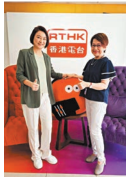
●李慧瑋(左)與作者喜迎國慶。

今天是中華人民共和國75周年華誕, 可喜可賀! 全國人大常委、立法會議員、專業會計師李慧瑋(Starry)表示一直能夠為國家出一分力、作貢獻是自己一種光榮, 她一直笑言自己是「誤入政途」。20年前她加入了民建聯, 旁人奇怪香港有很多年輕政黨, 為何要選傳統的, Starry耐心回應, 「當年因當義工認識了曾瑛成主席, 近距離接觸見到他們用汗水灌溉社區, 好踏實地去做每一件事。當時因為政治風浪輪了議席並不合理, 議會上要有正能量服務社區, 並非需要一些口號式的聲音, 我覺得要有專業人士站出來撐民建聯, 所以我加入了。」及後Starry更成為民建聯第一位女主席。到底她那愛國愛港的情懷是如何培養的? 「我在英國管治時期成長, 當初確實缺少了愛國主義教育的內容, 我有修讀中西歷史, 主要歷史段由鴉片戰爭至民國初期的建立, 對於新中國的成立, 其實是後來在地區認識一步步了解更多。國家的發展, 特別在全面改革開放後所取得的成績, 不單是經濟, 還有政治、文化, 以至生態文明等方面是全面發展。最感動見到國家全面脫貧, 國家真有這樣的魄力, 可以基本解決絕對貧窮。見到國家取得了今天的成績, 肯定是走對了方向……可能中間有一些內容需要不斷調整、更新, 這是必然的, 只要不斷改善自己的不足, 自然就會更好!」去年Starry當選全國人大常委, 心情如何? 「當時好忐忑, 因為全國人大常委人選全港只有一個名額, 是中央對我們的重視。我表達過擔心自己經驗不足, 未必能夠完全勝任, 但國家表示支持, 要我繼續去學習去提升, 於是我勇於接受這個挑戰。」今屆全國人大常委共175位, 其中75%是新人, 人大可有為這班年輕新常委設訓練班? 「全國人大常委委員長要求我們盡快投入角色, 和人民群眾聯繫, 網上也有e-learning去閱讀和學習國家的政策, 譚耀宗先生是我們的精神領袖, 給我很多寶貴的經驗。香港立法會發言有限時, 但在人大小組會沒有限制, 我是一位積極發言的常委。」能者多勞, 今年Starry更成為「愛國主義教育工作小組」的組長, 任重道遠, 「我們好團結, 好光榮可以幫助推動這個工作, 如果市民滿懷愛國情懷, 年輕人對國家愈來愈認同, 自覺地維護國家的發展利益, 以作為中國人而自豪, 開放政策的力度自然就更大膽了。國慶是一個普天同慶的日子, 我們一起懷著興奮感恩的心情去回顧和展望, 為國家的未來發展一起努力!」中華民族一家親, 同心共築中國夢, 祝願中華民族攜手並肩, 共創未來! 國慶節快樂!