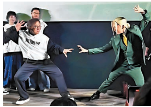
成龍與「瓦龍」夢幻聯動。

成龍喜歡與年輕人一起磨合喜劇細節,這也正是成龍電影中常會出現時與面孔的原因。此次《熊貓計劃》啟用了「喜人」史策,為影片增色不少,「喜人大軍」更是驚喜亮相首映禮現場,宋木子、張弛等十餘位「喜人」齊力助陣。主創們表示此次《熊貓計劃》是「中國人自己的熊貓電影」,集結了中國國寶與傳統功夫兩大元素。成龍說:「電影應該具有傳遞文化與情懷的作用,而『熊貓』和『功夫』這兩大元素就是民族的符號,更應該搭載在電影當中。」首映禮當日成龍盡顯精靈,不僅即場教小朋友招牌武打動作,向「小孩哥」學跳熊貓舞,還與《成龍歷險記》中的「瓦龍」夢幻聯動。有熱心影迷為成龍大哥贈送熊貓「萌蘭」公仔,童心未泯的大哥即刻將「萌蘭」背在肩上笑得合不攏嘴。 2008年汶川地震後,熊貓場館受到了很大的破壞,很多熊貓也受到了驚嚇。成龍當時就認領了兩隻熊貓寶寶,「龍龍」和「鳳凰」,牠們當時剛剛年滿一週歲。成龍對這雙「寶貝兒女」十分疼愛,還特意訂製了兩個同名的熊貓玩偶,走到哪就帶到哪,即便在獲頒奧斯卡終身成就獎的紅毯上也不離左右。「熊貓是我們的國寶,我們有功夫、有熊貓,為什麼不拍一部屬於中國自己的熊貓動作電影?」