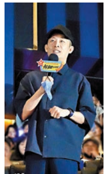
張譯希望年輕一輩都能以大哥為榜樣多拍佳作。