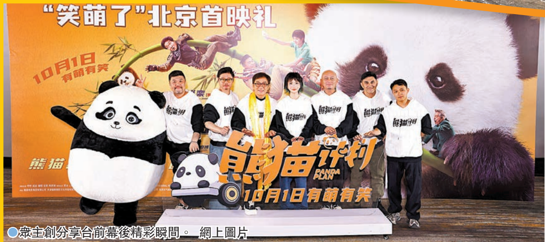
眾主創分享台前幕後精彩瞬間。網上圖片