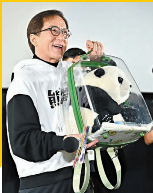
成龍獲影迷贈「萌蘭」公仔好得意。

電影《熊貓計劃》講述了熊貓幼崽(呼呼飾)被國際功夫巨星Jackie(成龍飾)認養,滿心期待開啟新生活。然而,呼呼獨有的「大小眼」特別基因卻被國際犯罪組織盯上了,組織首領不惜懸賞僱傭兵一億美元發起了一場熊貓搶奪戰。面對突如其來的危機,新晉奶爸Jackie怎能袖手旁觀?聯手金牌經紀人(魏翔飾)與熊貓保育員(史策飾)全力展開營救。「當猛打打的大哥遇到『大萌主』呼呼,秒變萌萌噠。」新鮮的角色設定與七旬老漢守國寶的趣味化劇情引人關注。