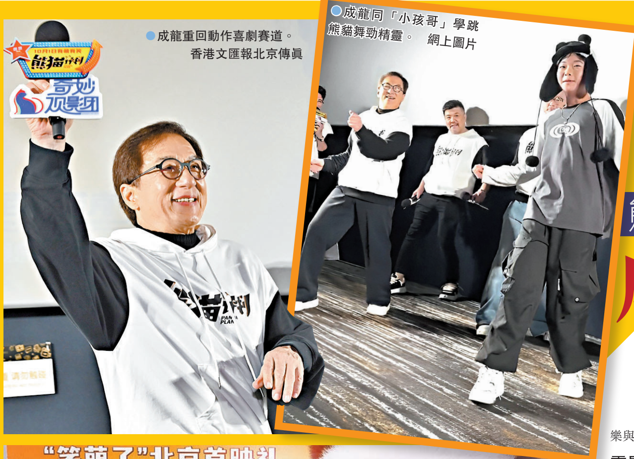
成龍重回動作喜劇賽道。香港文匯報北京傳真