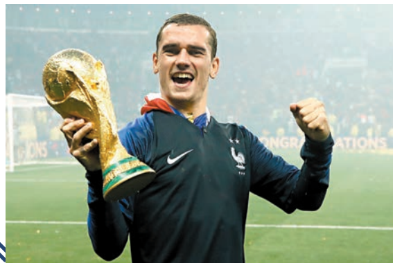
◀基沙文以進攻核心身份，協助法國隊登頂2018世界盃。資料圖片

在2016年歐洲國家盃、2018年及2022年世界盃上，基沙文三次幫助法國隊闖入決賽，並憑藉出色表現助力「高盧雄雞」贏得2018年世界盃冠軍。「這令人難以置信的十年充滿了挑戰、成功和難忘的時刻。現在是時候翻開新一頁，給新一代讓路了。我很幸運能與一些出色的隊友並肩作戰，我們一起分享勝利將永遠銘刻在記憶中。」