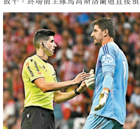
●高圖爾斯遭球迷投擲物件，比賽一度暫停。

最後時刻馬體會發起猛攻，95分鐘，後備登場的安祖哥利亞亞應直傳突入禁區，晃過高圖爾斯後於小禁區邊射入球門扳平，終場前主隊馬高斯洛蘭迪直接領紅牌亦無改1:1戰