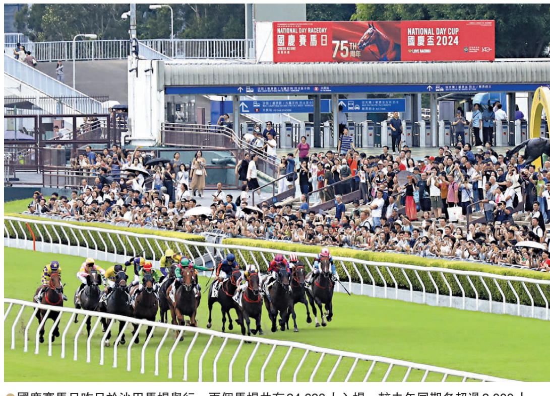
●國慶賽馬昨日於沙田馬場舉行，兩個馬場合共有24,698人入場，較去年同期多超過2,000人。