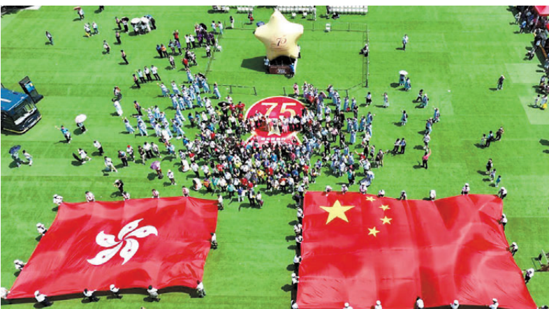
●「國慶同行 油尖旺跑出個未來」千人活動昨日舉行。

領航企業優選展示人工智能機械人，悟空機械人和熊貓機械人優悠表演舞蹈《我和我的祖國》，以獻禮祖國。