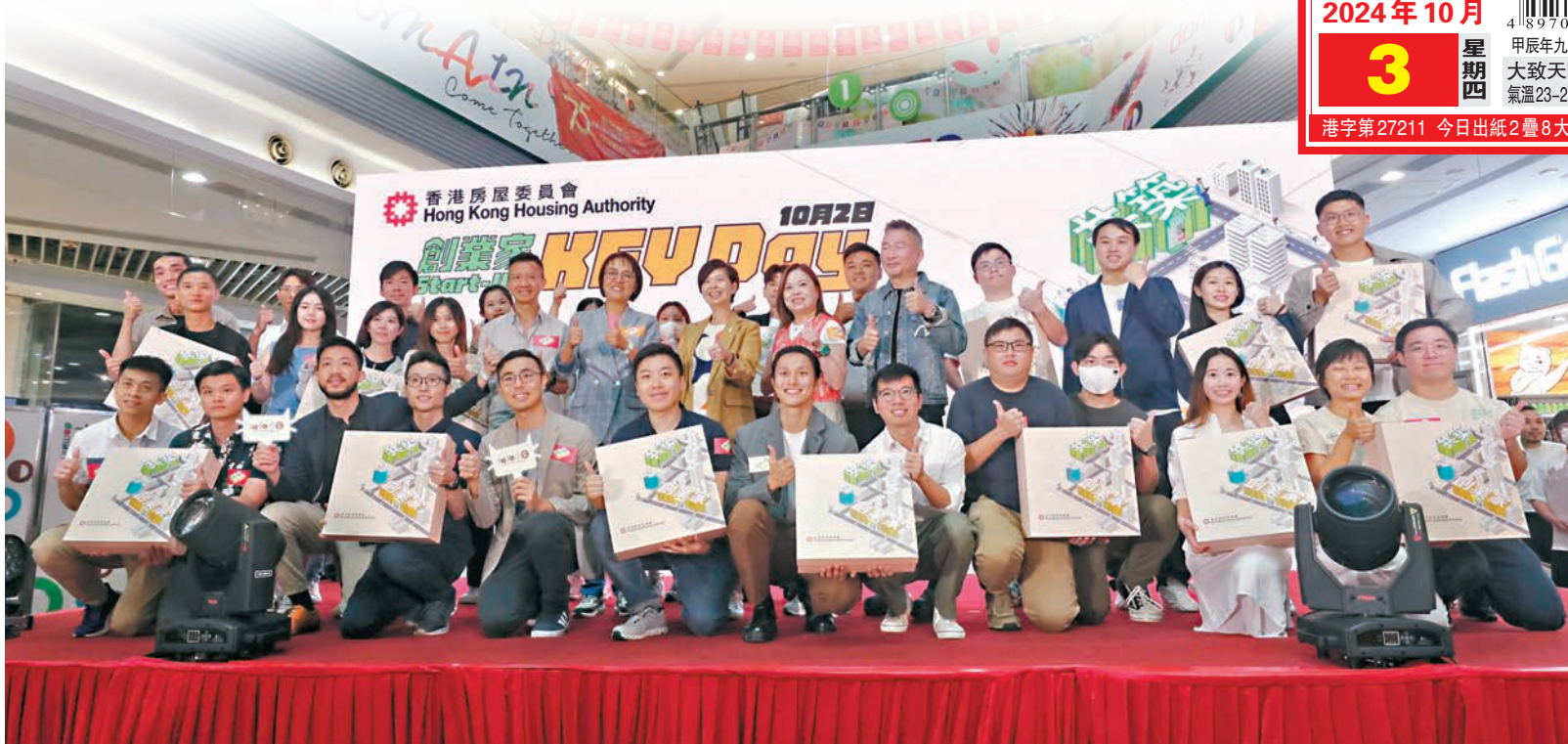
●房委會昨日公布，17個青年團隊入選「共築·創業家」計劃，入選者可免費承租旗下商舖7個月，幫助青年創業追夢。

香港房屋委員會轄下商場截至今年4月底的整體空置率達3.92%，屬近年高位。為地盡其用，房委會推出「共築·創業家」計劃，邀請青年動動腦筋和創意撰寫創業計劃書，勝出者可免費承租相關舖位7個月，為商場帶來年輕新氣象，並幫助有志青年追夢，達至雙贏。房委會昨日公布計劃下17個團隊當選，突圍而出的團隊點子多多，有的擬設立流浪貓多元化體驗館、售賣AI（人工智能）文創產品；有的擬設立24小時運作的「無人藥房」，放置銷售機自助購買藥物及醫療用品。有當選的青年向香港文匯報表示，過去的創業計劃因租金高昂而以失敗告終，而「共築·創業家」計劃免除租金壓力，較易讓創業青年實現夢想，亦帶旺商場。 ●文：香港文匯報記者 張弦