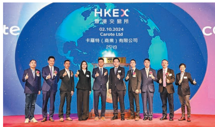
●卡羅特昨日掛牌上市，表現相當亮麗。

香港文匯報訊（記者 岑健樂）美國及內地先後放寬貨幣政策，推動近日港股大升，還帶動新股市場表現回勇。內地廚具品牌卡羅特(2549)昨日掛牌上市，表現相當亮麗。該股昨開報9.5元，已較招股價5.78元大升64.36%，盤中更一度飆升