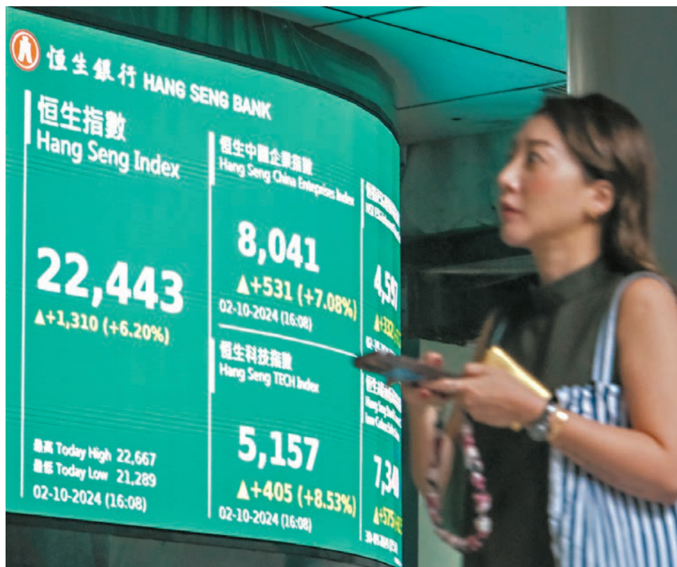
●港股連升6日，累漲逾四千點。昨日大市成交在「北水」暫停下仍高達4,341億元，為歷來第三高。

高盛的報告指，在內地以遠超預期的刺激措施推動下，全球對沖基金紛紛湧入中國股市，上周錄得2016年開始有紀錄以來最強勁的買盤，大量投資者急劇加大對中國配置。該報告指出，買盤主要集中在消費、工業、金融及信息技術相關股份；能源股是唯一被對沖基金小幅拋售的板塊。路透引述投資者和分析師表示，在低迷的經濟前景和地緣政治緊張局勢下，減持中國股票一直是過去幾年最大的「共識交易」，但現在風向正在轉變，「不僅是對沖基金和投機客，許多外國長期投資者現在也擔心錯失良機。」