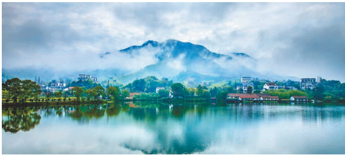
●浙江德清(古稱湖州武康縣)是孟郊的故鄉。

朱熹則作：「君詩高處古無詩，島瘦郊寒詎足差。」(《次韻謝劉仲行惠荀》)蘇軾之論一出，遂