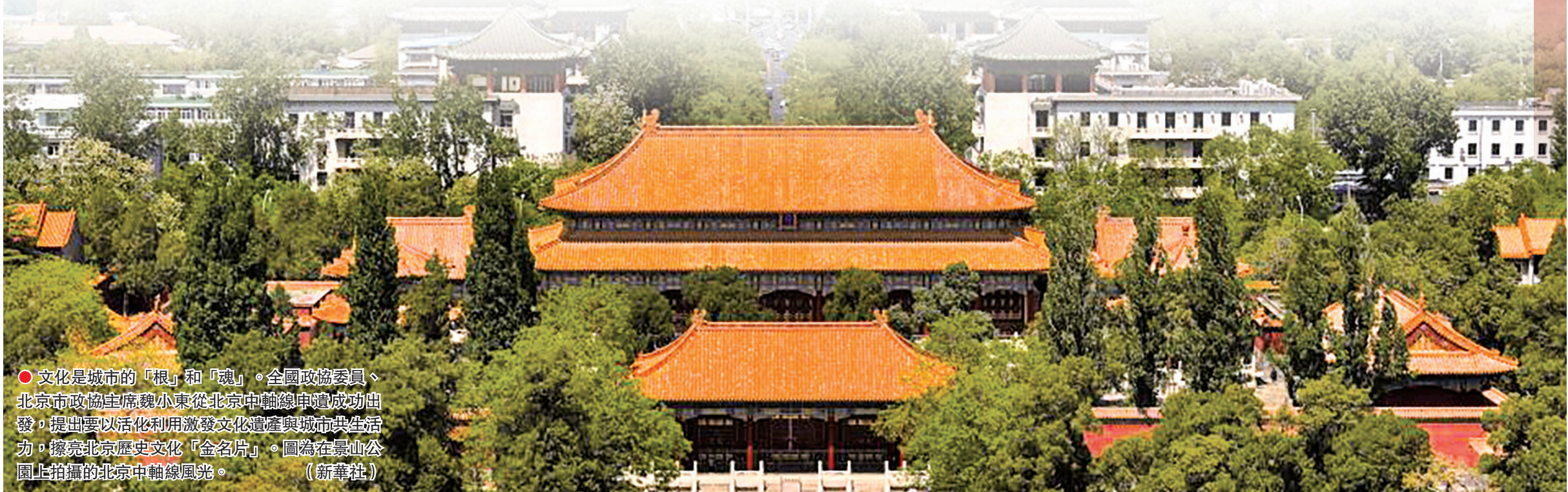
● 文化是城市的「根」和「魂」。全國政協委員、北京市政協主席魏小東從北京中軸線申遺成功出發，提出要以活化利用激發文化遺產與城市共生活力，擦亮北京歷史文化『金名片』。圖為在景山公園上拍攝的北京中軸線風光。

城市更新不僅是民生工程，更是發展工程。交流探討中，委員們一致認為，作為一項綜合性、系統性的複雜工程，城市更新需要各方積極參與、共同推進。隨着人人參與、人人負責、人人奉獻、人人共用的城市治理良好氛圍的構建，有創新有特色、可複製可推廣的城市更新之路一定會越走越寬廣。