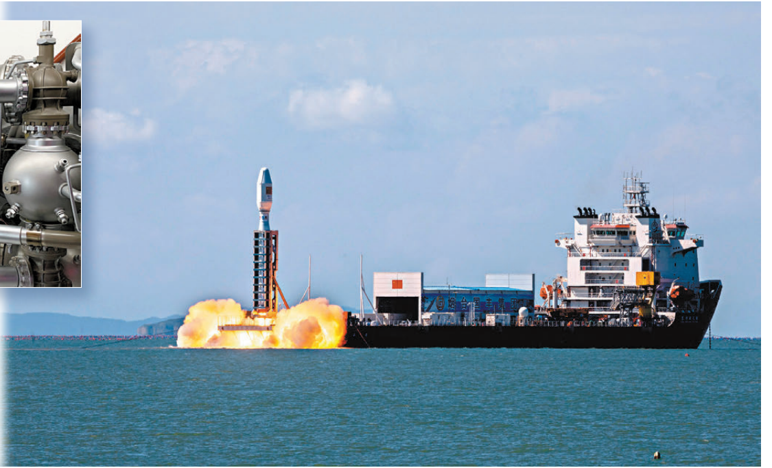
▶太原衛星發射中心在山東海陽附近海域使用捷龍三號運載火箭發射衛星。資料圖片

後，其助推器及第12級的殘骸可直接落入海中，所以能大大提高火箭殘骸墜落的安全性，即使在升空時發生故障或爆炸，也不會殃及平民或地面設施。當然，在海上發射火箭也存在一些不利因素，如容易受到海鹽空氣的侵蝕，且海上多雨和颱風，天氣情況複雜。此外，火箭發射時間不是隨時隨地，而是有發射視窗的要求，發射視窗是指最適合發射火箭進入預定軌道的特定時間段，需要考慮軌道參數、天氣條件等因素。