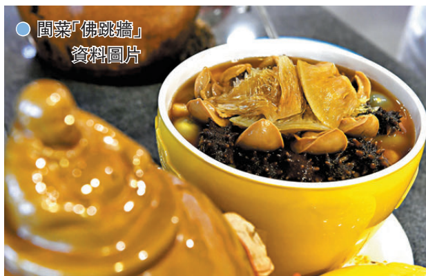
●閩菜「佛跳牆」資料圖片

各大菜系的形成，與中國歷史的發展密不可分。從唐宋時期的「南人嗜鹹，北人嗜甘」到清代的「四大菜系」，再到民國時期的「幫口」概念，菜系的演變如同一部活生生的歷史書，記錄下中國飲食文化的變遷。例如，魯菜作為宮廷第一菜系，是黃河流域幾千年齊魯文化孕育熏陶下的產物，其歷史可追溯至夏朝；而川菜則