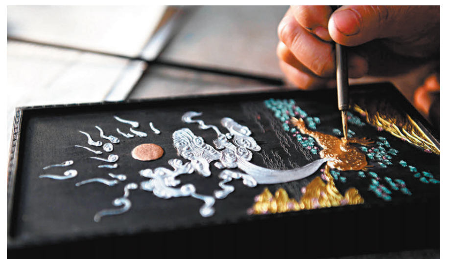
●圖為「項氏徽墨」的工人為晾乾的墨進行描金。