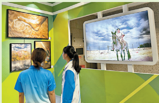
●「南北之光」中國·烏拉圭攝影藝術交流展吸引眾多觀眾。

憶述今年7月在北京舉辦的個人攝影展，馬塞洛·卡塔尼表示：「在北京的展覽達到了我的預期，展覽的主旨是用一些照片來展示我們的國家是怎樣的，以及我們想怎樣向世界展示它。其中