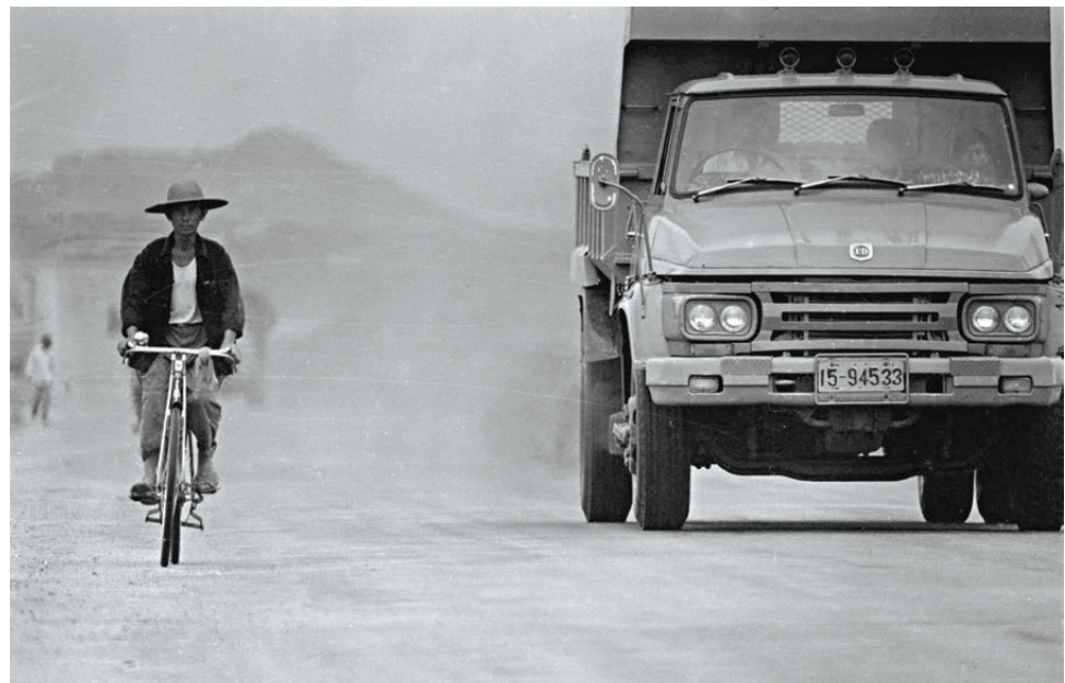
●1981年的深圳。

他曾是美聯社首席攝影記者，1992年獲普立茲獎「現場新聞攝影獎」，被稱為「中國的亨利·卡蒂埃-布列松」……攝影師劉香成的成就毋庸贅述，從畢業後拿起相機和記者證至今，他始終奔波在世界各地，以光影記錄下無數影響世界的決定性瞬間。今年，永不言休的他開辦了為期三年的「一帶一路」攝影新長征，計劃踏足40個沿線國家和地區，用影像訴說當地華人的故事。「我報道中國已有40年左右，對我來說，『一帶一路』是一次新的長征，延續了我見證和講述中國故事的願望。」 ●香港文匯報記者 張岳悅