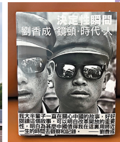
●《劉香成：鏡頭·時代·人》輯錄了約200幅珍貴的攝影作品。