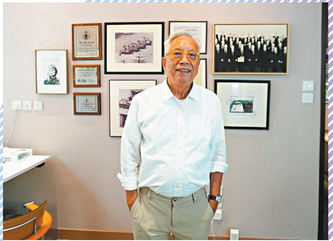
●劉香成矢志持續記錄中國人的故事。

人生沒有白走的路，兩次赴中國的經歷不僅堅定了劉香成的目標，亦為他1978年成為《時代》派駐北京的唯一一名攝影記者奠定了基礎。由此，他開始記錄中國改革開放後的城鄉風貌，以及人民精神氣質的變化。「無論做什麼事，都要想得再長遠一些，也要對歷史有些興趣和看法，而不是只關注明天或者明年要做什麼。這成為了我的工作方式和方法，也是我會被派往多個國家的原因，所以我一直說，機會是留給有準備的人。」