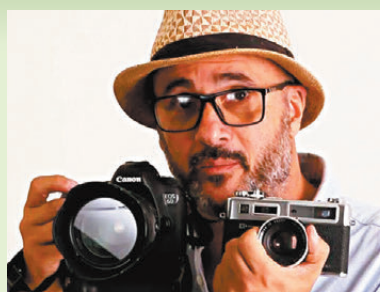
●馬塞洛·卡塔尼從攝影中找到了觀察和展示世界的方式。

劉香成本月9號將於香港中文大學以「鏡頭下的中國和世界（1976-2024）」為題舉行公開講座，回顧自己近半世紀的攝影生涯以及作品所記錄的歷史瞬間，並探討如何藉照片講述從改革開放到「一帶一路」的當代中國故事。他說：「我希望通過照片使談話回到原點——如何培養一個人的好奇心，所有的教育都要回到這個原點，而我將自己的好奇心通過照片表達出來。攝影有無限可能，我對這個題材有興趣，又為此花了時間，最終便得到這樣的結果。」