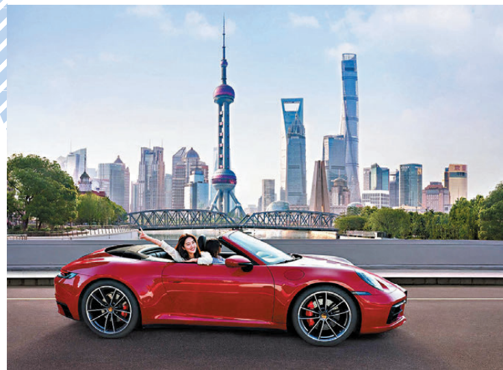
●2021年，女演員楊采鈺在上海外灘兜風。