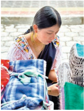
厄瓜多爾擁擠南美各式面貌縮影，包括純種、混血的印加人面相。

當我們轉去高原上印加城鎮Otavalo所見，卻是五官比較突出，不少看來為混血臉孔的族群；混血根源有拉丁族裔Latino，也有不少看似我們華人，色澤比較白皙，輪廓比較斯文的族群(今天選用的照片，便是在Otavalo周末市場擺攤的售貨少女，看來百分百華人面孔)。當我們向著南部進發，來到被稱為The Gateway to the Amazon(前往亞馬遜河的大門)的著名旅遊城市Banos，卻看到比例極多，擁有歐洲