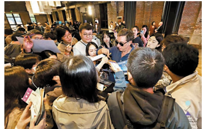
●米格爾·戈麥斯為影迷簽名。

「《壯遊》的靈感來自於毛姆小說《客廳裏的紳士》當中的兩頁紙，裏面描繪了主人公在緬甸的遊記和旅行當中的經歷。後來研究發現這件事並不存在，而是虛構的，甚至是一種反諷，即男人是懦夫，而女人很頑強，我們就以此做故事的基礎。但我們想一部電影也不止是一個故事，所以在用電影講故事的時候，不是你頭腦當中有了一個影像你就可以去講，而是有更深層次的原因催促你去講。整個電影不管上半部還是下半部，都是把現實與虛構的世界相融合，電影在風格上的衝撞表現為像奧茲和堪薩斯州的對立，現實和虛幻世界的對立，可以說現實拍出來比奧茲還像奧茲，現實變得像超現實一樣，這是電影的魔力，通過電影來形成過濾和昇華。」米格爾·戈麥斯說。