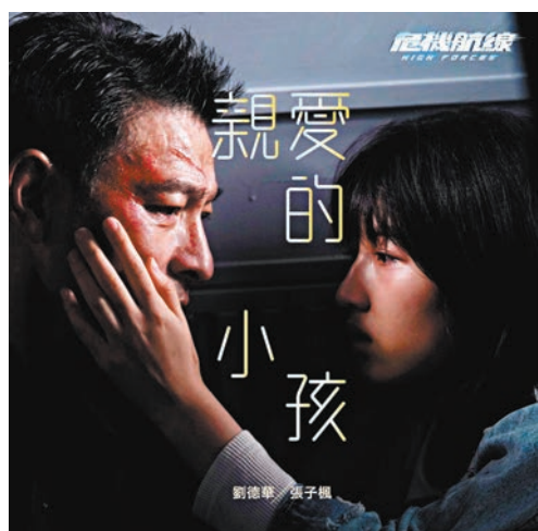
●劉德華夥張子楓重新演繹《親愛的小孩》。

香港文匯報訊（記者 阿祖）劉德華監製及主演的高空犯罪電影《危機航線》即將於本月10日在香港上映。10月1日國慶日推出優先場，多場近乎全滿，入場率相當理想，反映觀眾對電影期待度甚高。