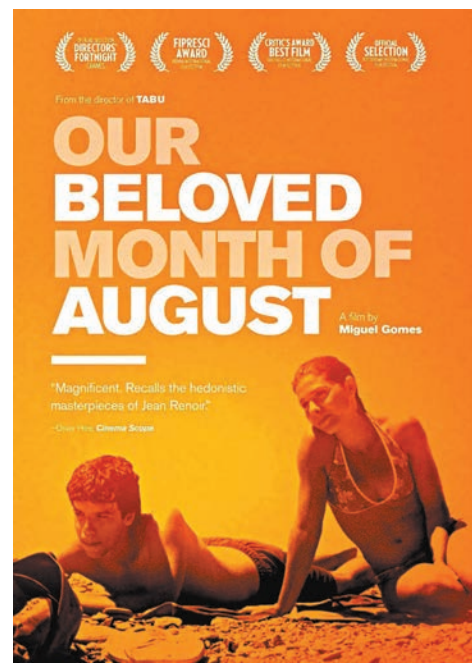
●《可愛的八月》在紀實與虛構間不斷跳脫。