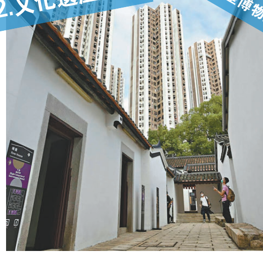
◆三棟屋博物館、德華公園等古建築，可改建內部客家古屋為書店、咖啡廳