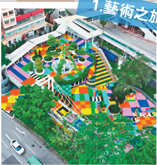
▲「藝遊未盡·荃灣」活動中的七組藝術裝置，建議保留常設 ▼如心園、南豐紗廠等景點，可打造為文創旅遊地標