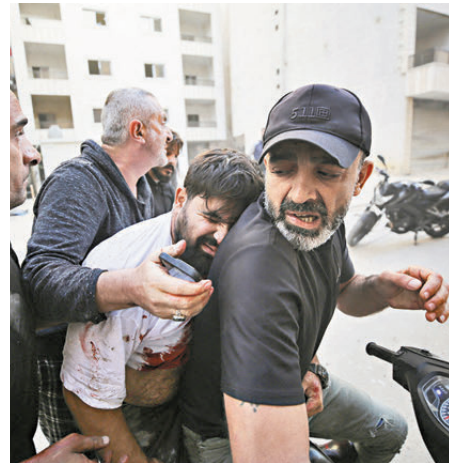
●以色列連番空襲致黎巴嫩平民受傷。

以軍還表示，在與情報部門的聯合行動中，以空軍對約旦河西岸北部城市圖勒凱爾姆地區進行打擊，擊斃該地區一名哈馬斯負責人及多名成員。巴勒斯坦衛生部則指以軍空襲造成18人死亡。