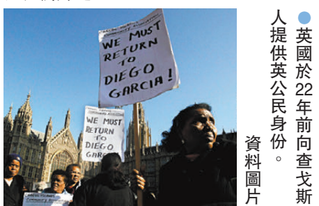
●英國於22年前向查戈斯人提供英公民身份。資料圖片

着查戈斯人這樣做？正是因我們的膚色，我們才受到這樣的對待。我們和家人一起逃離毛里求斯，現在我們又被送回他們身邊。」