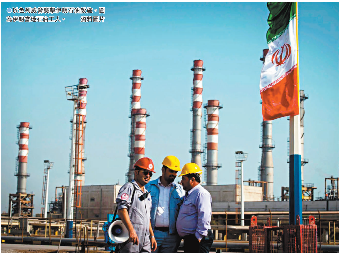
●以色列威脅襲擊伊朗石油設施。圖為伊朗當地石油工人。