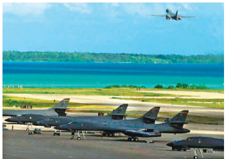
●英協議保留與美國在迪戈加西亞島的軍事基地。法新社

英國仍在海外控制其他殖民地，例如位於阿根廷領海內的馬爾維納斯群島。在英國放棄查戈斯群島主權後，阿根廷隨即矢言要奪回馬島的「完全主權」。