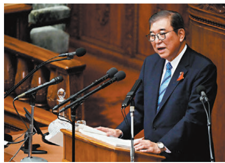
●石破茂發表首個施政演說。

推進與中國的戰略互惠關係，推動兩國各層級之間的溝通交流。同時，將通過對話與合作，努力與中方共同打造「建設性的、穩定的」日中關係。他還指出面對當前分裂與對立不斷加劇的國際社會，應從現實出發，以國家利益為基礎，處理好外交與防衛的平衡，實現國家及地區的和平與穩定。