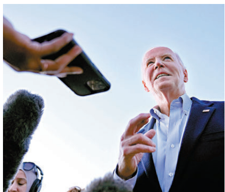
●拜登稱不相信以色列及伊朗會爆發全面戰爭。

伊朗消息人士稱，伊朗政府已透過卡塔爾向美方表示，伊朗單方面自我克制階段已結束，以方針對伊朗的任何襲擊都將遭到「非常規回應」，包括伊朗將打擊以色列基礎設施。伊朗外長阿拉格齊周五抵達貝魯特，與黎巴嫩看守政府總理米卡提和國會議長、真主黨盟友貝里會面。