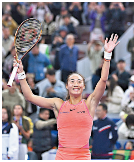
●鄭欽文在賽後慶祝勝利。