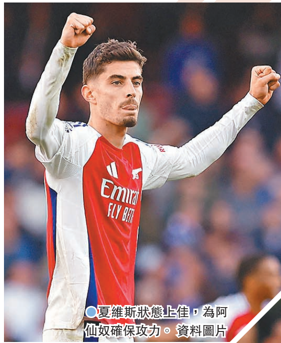
●夏維斯狀態上佳,為阿仙奴確保攻力。

剛在中網展現不俗實力的另一位中國球手布雲朝克特4日也止步首輪,他賽後承認:「我想打球,也想贏,但真等到比賽開始之後,卻感受不到那種能量,所以身體也開始變得懶散、緩慢起來,而我還找不到解決辦法。」在布雲朝克特看來,密集的比赛讓他沒能好好休息調整到最佳狀態。