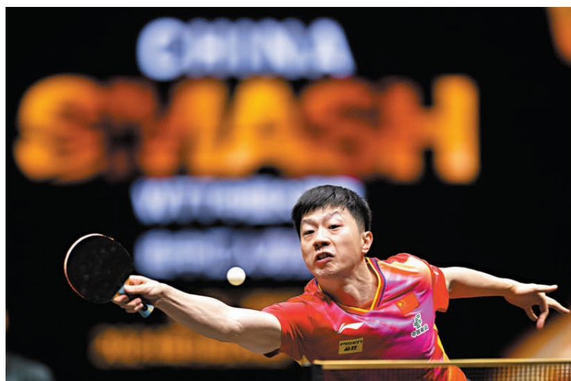
●馬龍晉級WTT中國大滿貫男單4強。

「看上去是4:0,但實際在每一局的前半局面和中局,比分都是咬着的。」馬龍表示,儘管比分看似懸殊,但比賽過程並不輕鬆,自己在後半局中抓機會和處理球上做得更好,給自己贏球創造了機會。接下來,馬龍將在準決賽對戰梁靖崑。針對後續的比賽,馬龍表示,之後的比賽一定會一場比一場艱難,希望自己可以享受着這片場地,享受乒乓球帶來的樂趣。