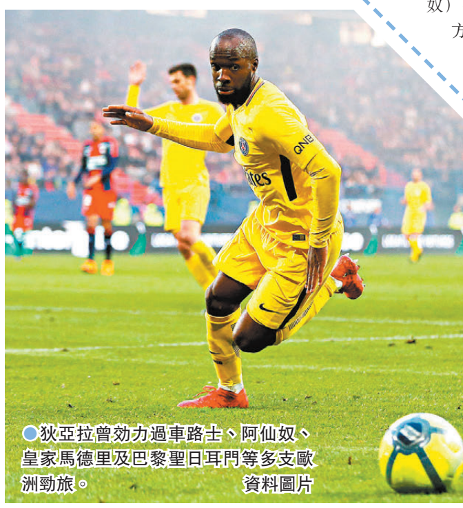
●狄亞拉曾效力過車路士、阿仙奴、皇家馬德里及巴黎聖日耳門等多支歐洲勁旅。

2014年,俄羅斯球會莫斯科火車頭以球員違反合約為由終止狄亞拉的合約,還向後者索賠2,000萬歐元。現年39歲的狄亞拉當時拒絕,並要求會方支付他賠償金。FIFA最終命令他支付前球會1,000萬歐元,並追溯禁賽15個月。根據FIFA規定,如果球員無正当理由由下單方面終止合約,便必須付賠償金,包括合約結束前的報酬等。購買該球員的球會也可能要共同承擔賠償責任,因此在狄亞拉離開火車頭後,並沒獲得很多球會向他招手。他的律師辯稱,這規定違反了歐盟勞工自由流動的規定,且限制球會招募能力,也違反了27國集團內部自由競爭的原則。