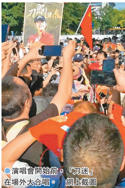
●演唱會開始前,「刀迷」在場外大合唱。網上截圖