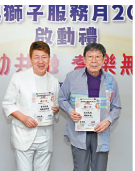
●胡楓及何國材擔任愛心大使。

美食。修哥話要保持活力就要有健康。有些人會很活躍,有些人會收埋自己,他當然是活躍派,所以一定要識得保持身體健康。修哥又計劃開演唱會,問他想再破紀錄嗎?他說:「一切都未知,係有機會再開,因為開演唱會係好開心。(再破世界紀錄嗎?)係呀,希望一直破紀錄就最好。」至於拍劇,修哥稱無綫因為不想他捱夜,所以暫時未有劇集。