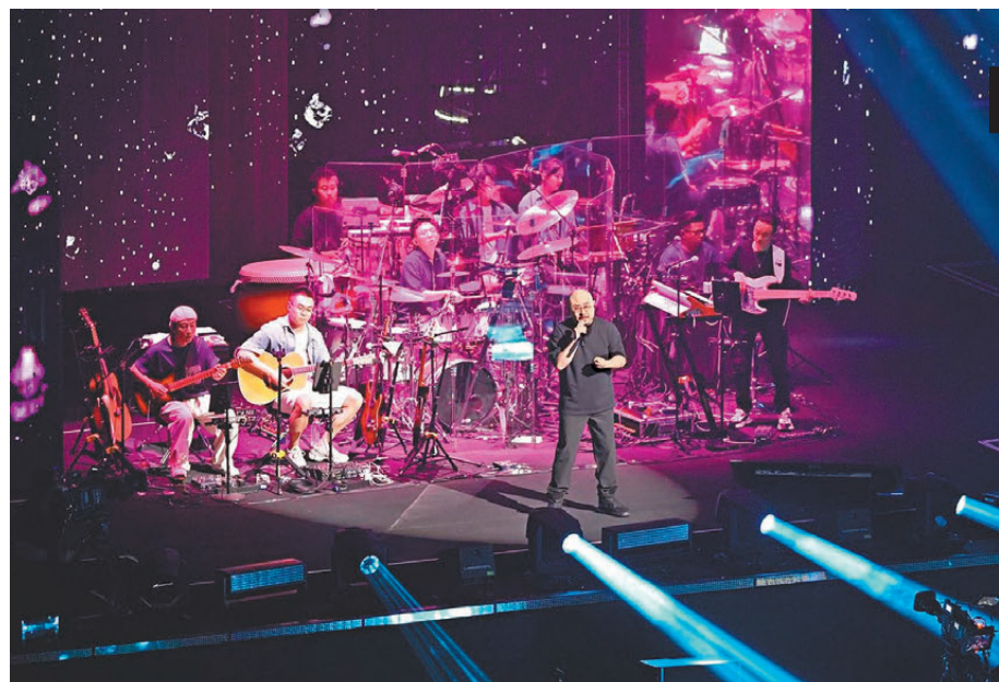
●刀郎廣州演唱會昨晚開唱。