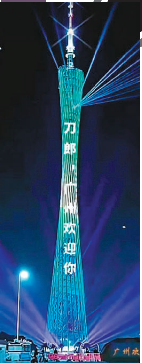
●廣州塔亮起歡迎刀郎開唱的標語。

記者瀏覽各個社交平台發現,不少網友紛紛晒出演唱會門票或者訂單截圖。原本480元(人民幣,下同)到1,280元的區間票價,能夠原價購票的幸運觀眾少之又少,紛紛慨嘆「太火了」「搶不到」!有網友花費5,000元購買了一張880元的票;也有網友晒出15,000元的訂單代買到兩張內場票。買到票的網友紛紛表示,搶票全程就像「高手出招」,主打一個「秒罄」驚嚇。而在相關購票平台,「想看」的一欄有超33萬人點讚,大家都期待下一場可以如願入場。