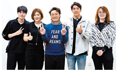
●陳奕迅與孫佳俊、傅園慧、葉詩文和吳越合影。

另外,前日是Eason女兒陳康堤(包包)的20歲生日,Eason太太徐濠縈分享朋友及歌迷送給包包的生日祝福,以及包包由細到大的可愛影片及照片。雖然女兒前天未有入場看爸爸演出,但Eason也在安歌環節中選唱《天下無雙》,作為送給女兒的生日禮物,場面溫馨。