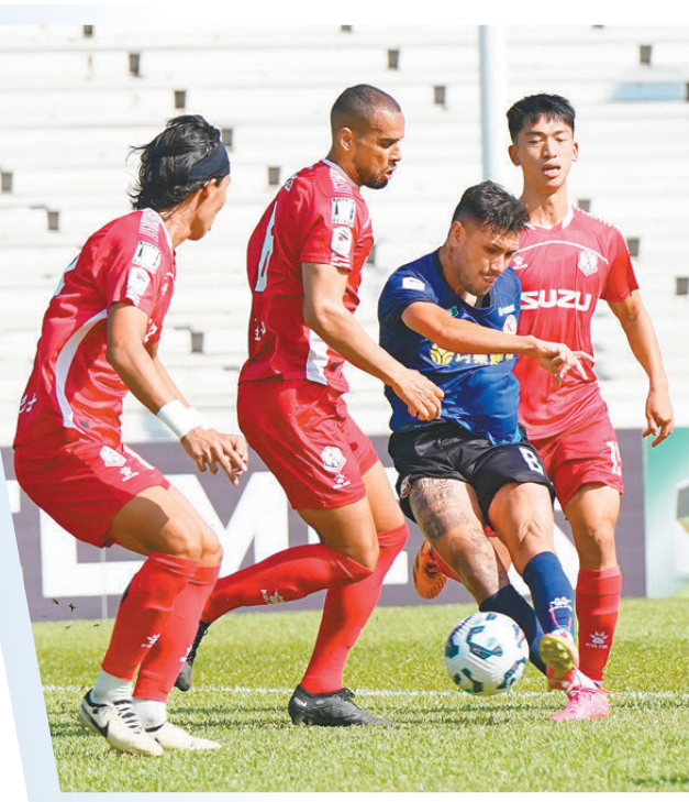
●肯迪（藍衫）在人群中起腳。