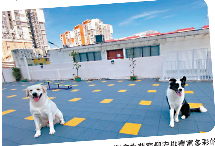
●一些「寵物樂園/幼兒園」還會為萌寵們安排豐富多彩的活動。圖為廣州一家寵物幼兒園，寄養的狗狗們正在戶外玩耍。