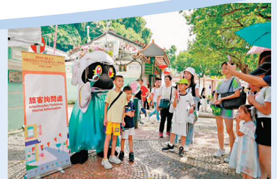
●澳門氹仔舊城區設「臨時行人專用區」。圖為遊客與澳門旅遊吉祥物互動。

「今年國慶黄金周全力發揮『旅遊+』的功能,推廣澳門『盛事之都』、『美食之都』,力爭把澳