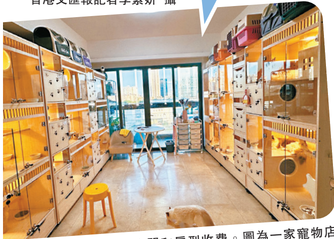
●寵物寄養通常按空間和房型收費。圖為一家寵物店的貓櫃。