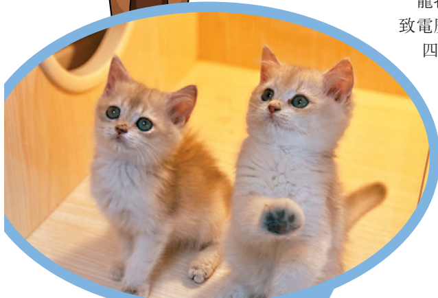
●可愛的萌寵正形成千億級消費市場。