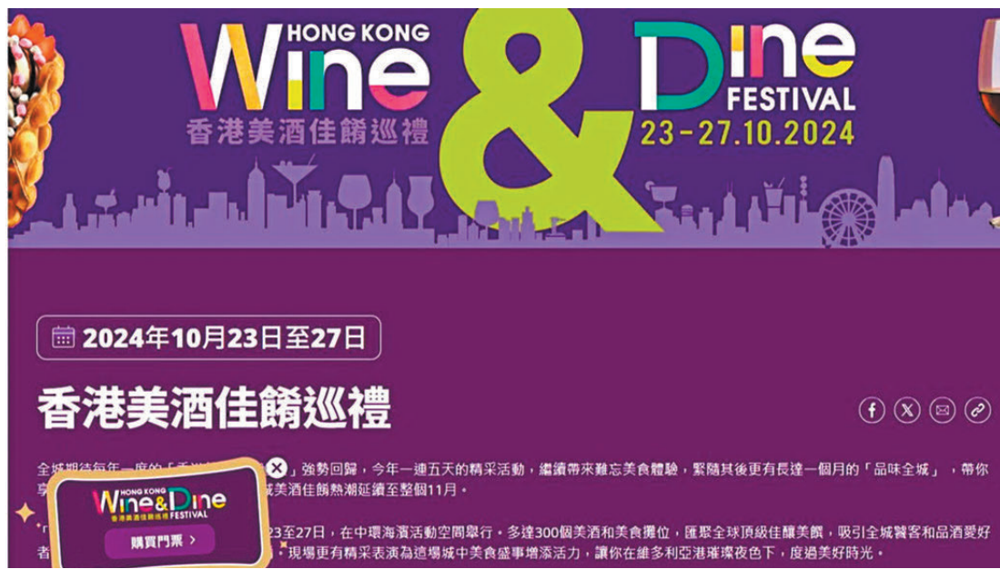
●香港美酒佳餚巡禮將於10月23日起一連五日在中環海濱活動空間舉行。

除法國波爾多、智利和澳洲等熱門葡萄酒產區，今年還有全新特色酒品隆重登場，其中寧夏、雲南、山東等中國葡萄酒和烈酒新星嶄露頭角，場內有機會試到四大國宴用酒之一的貴州白酒，以及著名酒評人James Stuckling評為「年度中國十大葡萄酒」之一的蛇龍珠紅葡萄酒。至於各國領事館推介的佳釀和美食，包括英