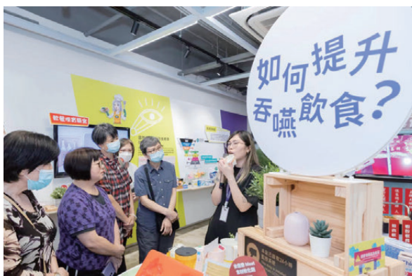
▲婦女自強基金資助參觀活動。