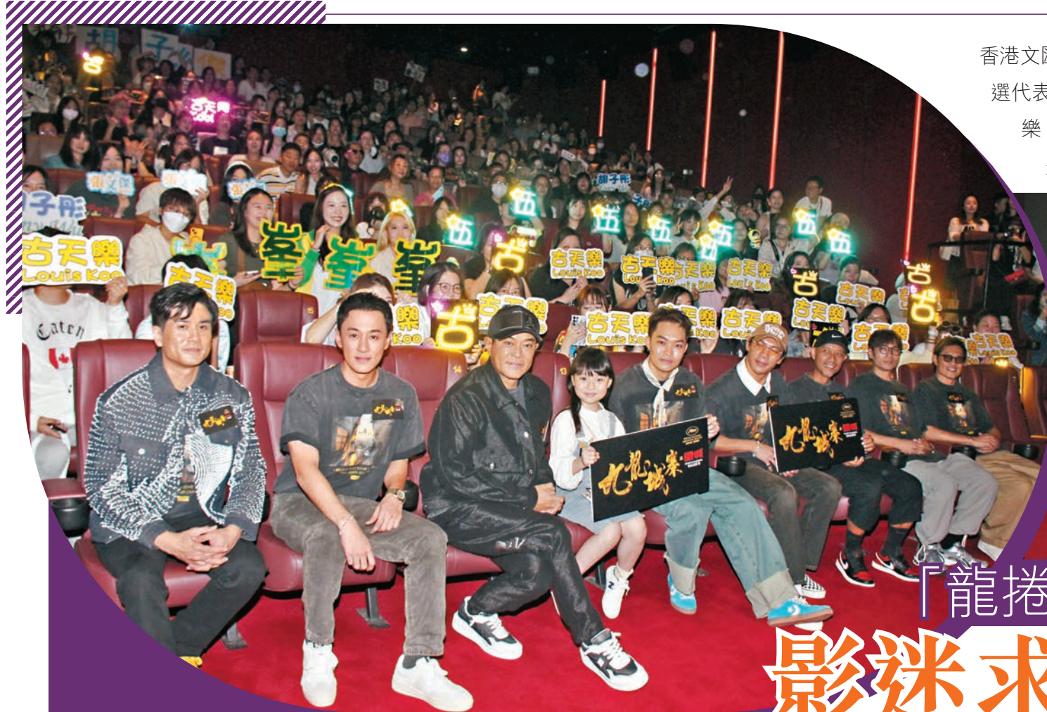
●古天樂、林峯、胡子彤、張文傑、伍允龍等人昨日到戲院出席答謝場。

香港文匯報訊(記者 達里)電影《九龍城寨之圍城》(簡稱《九龍城寨》)獲選代表香港出戰奧斯卡角逐「最佳國際劇情片」,昨日戲中主要演員包括古天樂、林峯、胡子彤、張文傑、伍允龍及黃德斌等人到戲院出席答謝場,不少觀眾都打扮成戲中角色造型,更有熱情粉絲自製標語,要求演員「娶她」和與古天樂演的「龍捲風」一起跳《今期流行》,場面歡樂。