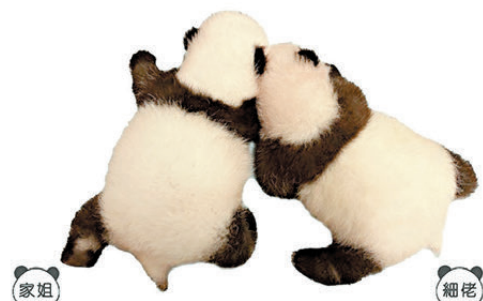
●海洋公園稱兩姐弟的「MBTI」是「CUTE(可愛)」。