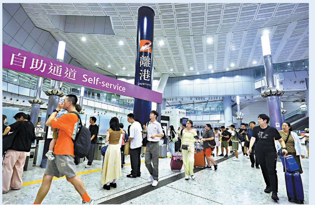
●西九龍高鐵站現離港人潮，人人大包小包滿載而歸。