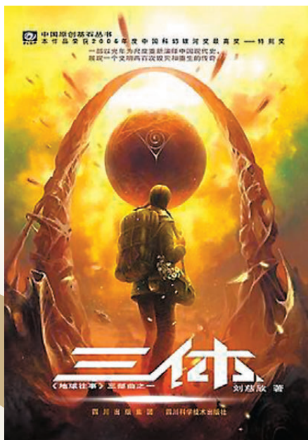
●《三體》首部曾獲雨果獎最佳長篇小說獎。