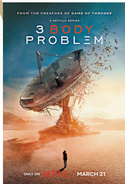
●今年3月上線的網飛版《三體》上映一周就升至網飛全球收視榜首。