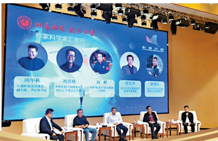
●劉慈欣(左二)參加作家科學家座談活動。

他還表示，相較於其他文學類型，科幻文學之所以具有獨特的吸引力，很重要的一點就是科幻文學是從科學技術中提取故事資源，這些資源是在傳統文學中找不到的。一般印象中，科學總是用很晦澀的專業術語進行表達，但假如真的明白它所表達的內容，就會發現其中蘊含着驚人的想像，這種想像遠遠超出人們日常的經驗。