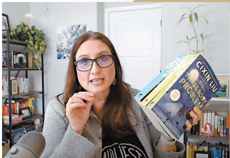
●海外博主發布解讀劉慈欣作品的視頻。