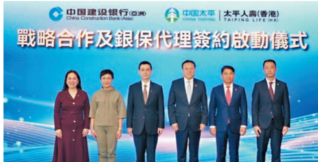
●中國建設銀行(亞洲)與中國太平人壽保險(香港)戰略合作協定及銀保代理協定簽署啟動儀式現場。

新增客戶按年升85%,當中100萬港元以上的高淨值客戶按年更升1.43倍,本地客比訪港內地客佔比稍高,因高息環境下定存具競爭力,而財富管理服務亦受歡迎。