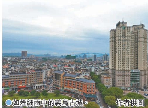
如煙細雨中的義烏古城。

冊市場經營主體第一大縣，註冊主體達110.36萬戶。而跨境電商的蓬勃發展，讓這個名聞遐邇的「世界小商品之都」再次煥發出活力。截至2024年上半年，義烏註冊電商主體累計已達65.21萬戶，其中40%以上開展跨境業務。義烏外貿訂單的重要組成部分是小規模、多品種的小商品拼箱出口，Temu、SHEIN、TikTok等跨境電商平台引領的半託管模式讓義烏跨境賣家擁有了更大的自由度來承接小批量、多批次特徵的訂單。據義烏海關數據顯示，今年法國對中國的進口額猛增40%以上，80%的奧運產品和設備，包括開幕式上各國各類旗幟、上百萬件奧運吉祥物、許多國家運動員的運動服、觀眾助威棒、觀賽望遠鏡等，都發自義烏。坊間傳言，美國總統大選的結果，最早是從義烏生產的小旗子和T恤衫反映出來的。