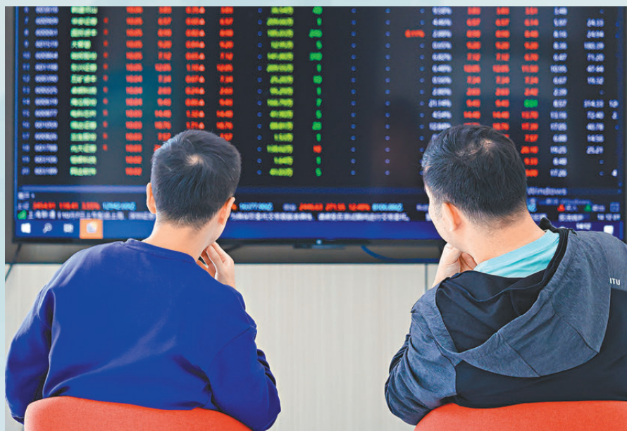
●A股昨日長假後復市，一如預期延續瘋漲模式。