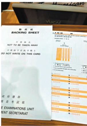
●公務員CRE試場內相片懷疑被考生上載至小紅書。

香港文匯報訊 上周六（5日）剛剛舉行的公務員入職綜合招聘考試（CRE），有考生懷疑將試場內相片上載至小紅書，包括展示考試答題紙。公務員事務局昨日表示會嚴肅跟進違規個案，涉事考生可能面臨書面警告、扣分，甚至取消考試資格等。目前該條引起爭議的帖文已被刪除。 翻查小紅書，點新聞記者發現有不少網民分享香港CRE考試備考攻略，大多帖文都上載有試場外拍攝的的座位表及告示，部分相片亦有影到疑似考生或監考員等。其中一名用戶以「談談香港CRE裸考後感」為題發文，帖文中更展示有「香港特別行政區政府」字樣的答題紙，仍未有填寫考生信息及做題。目前該帖文已被刪除。 公務員事務局表示，考試前已通過電郵提醒考生仔細閱讀考生須知，當中列明禁止在考場內攝影、錄音或錄影。考試當日試場亦有張貼告示再次提醒考生，而在整個考試過程中考生必須關掉手提電話等設備。局方將嚴肅跟進違規個案，違者可能面臨書面警告、扣分或取消考試資格。至於試場外的座位表及告示，公務員事務局則指不屬於考生須知內不可攝影的範圍。 涉及試場為10月5日舉行的公務員入職綜合招聘考試（CRE）以及基本法及香港國安法測試，全港設立約100個試場，共邀請約24,500名考生出席，出席率約為75%。