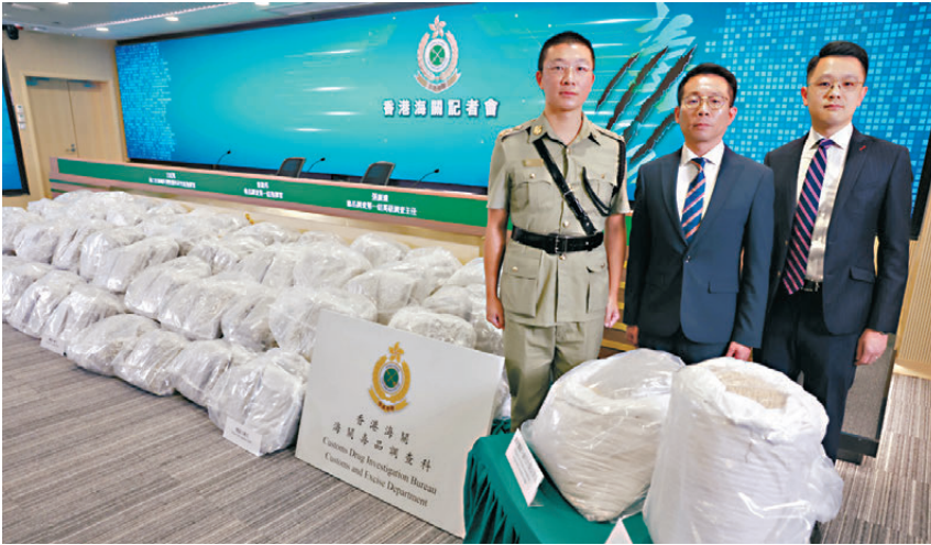
●海關講述在海運貨櫃偵破500公斤大麻花案件詳情及展示證物。

香港文匯報訊（記者 蕭景源）香港海關繼今年2月偵破一宗涉及570公斤大麻毒品案後，上月27日根據風險評估和情報分析，查驗一個由加拿大經海運入口，報稱載有500多袋黃豆的貨櫃，在當中83袋黃豆中發現藏有約500公斤大麻花，市值約1.3億元，其後進行監控遞送行動，至本月2日先後拘捕3人（44歲至55歲），現正設法追緝幕後販毒集團主腦及涉案人物，不排除有更多人被捕。 海關毒品調查科毒品調查第一組指揮官曾建邦、高級調查主任張廣達，以及海關港口及海域科貨物資料研究組指揮官王紀翔昨日表示，涉案報關貨物因寄貨人是一間海外服裝公司，業務與這票貨物性質完全無關，加上大部分北美地區已將大麻合法化，海關過往亦偵破用不同食品作掩飾的走私毒品案，遂扣留該個貨櫃作進一步檢查並揭發案件。 至於被捕的2男1女分別報稱物流公司女職員及男司機，當中一名54歲男司機持有雙程證，初步調查3人互不相識，相信販毒集團一直在背後暗中監控該票貨物，並圖以「截斷式」操作增加海關執法難度。至於用作收藏毒品的83袋黃豆，只佔整體貨物約16%，且全部擺放在貨物最底層位置，亦是販毒集團企圖增加海關檢查難度。