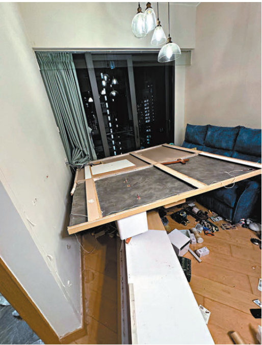
►「阿布」日前遭塌下的電視牆壓斃。

討回公道，更直言他和太太也要為此事向精神科醫生求醫。 涉事的裝修公司昨日凌晨在社交平台表示，對於意外事件表示最深切的哀悼，願貓貓安息。姓吳設計總監亦發布一段影片，對事件公開道歉並鞠躬表示歉意，又指公司開業至今並無發生類似事故，負責保養及跟單的同事早前收到客戶通知後，已即時派出工程經理到單位作出了解及跟進，打算提供傢俱重組