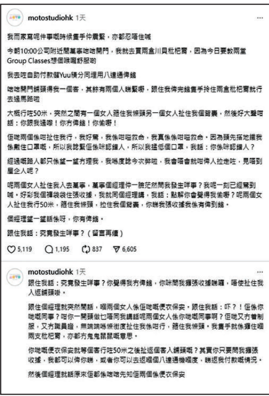
●女事主以 motostudiohk 賬號在Threads發文，指遭便衣保安粗暴對待。