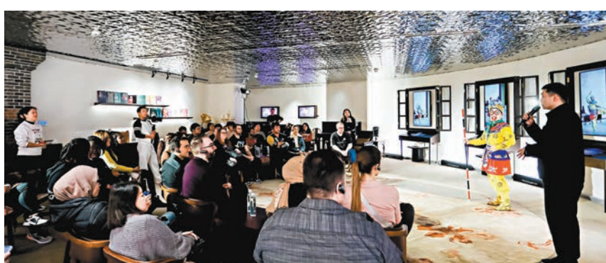
●海內外網文作家於第二屆上海國際網絡文學周感受中國文化。