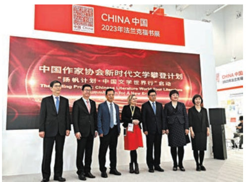
●閱文集團參與法蘭克福書展。