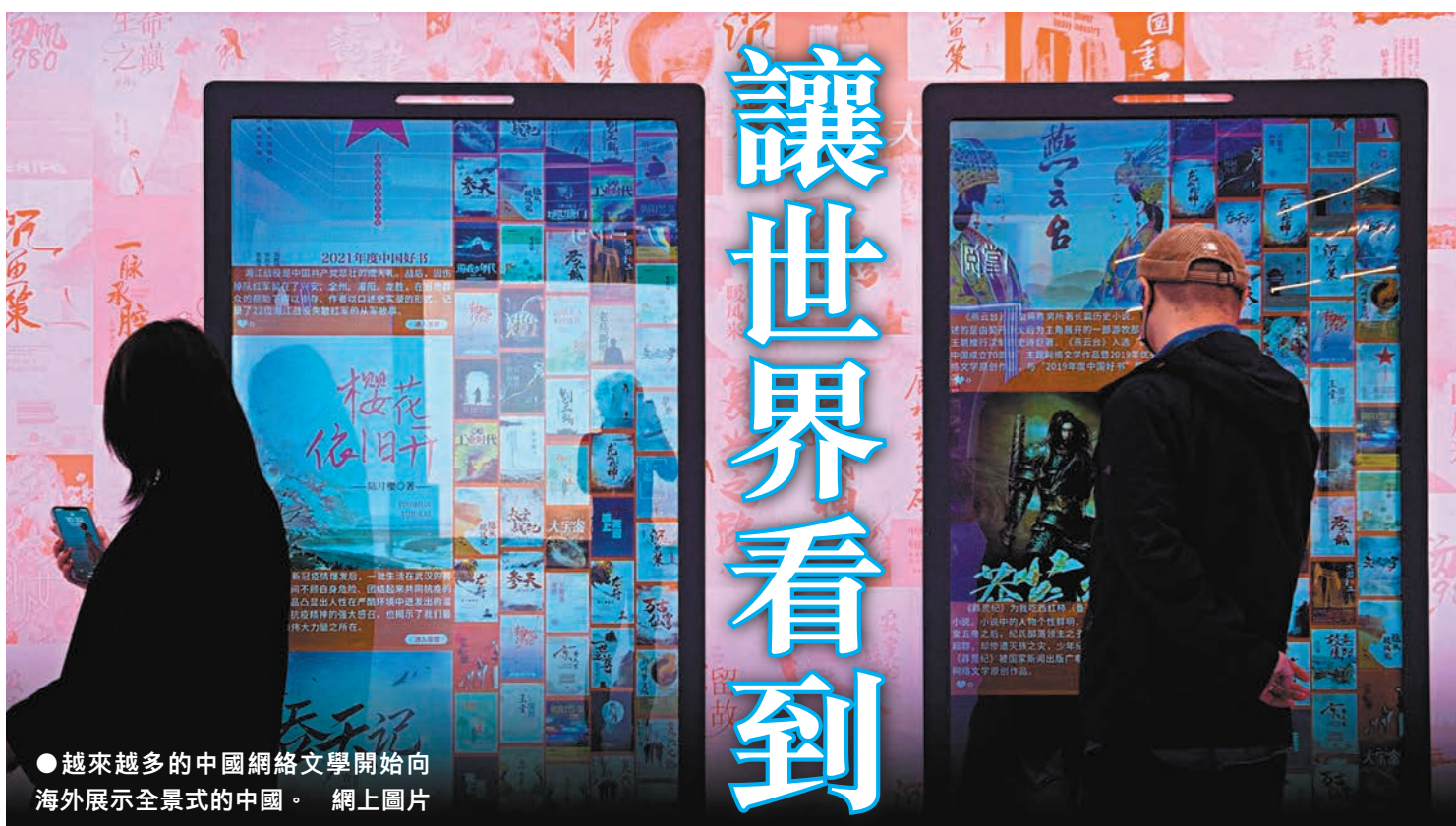
●越來越多的中國網絡文學開始向海外展示全景式的中國。網上圖片