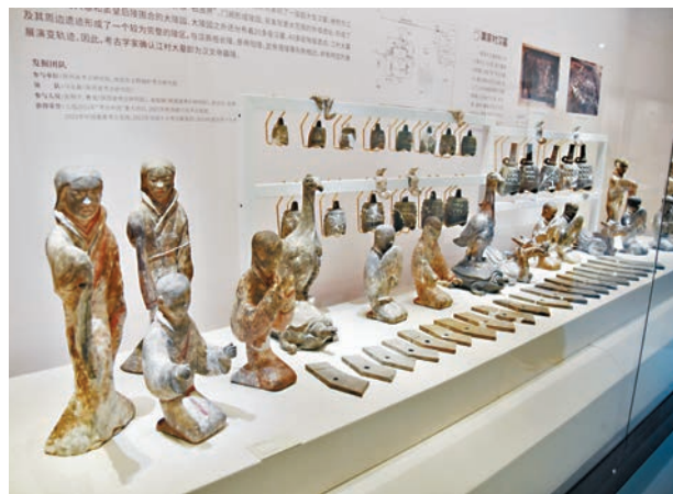
●由伎樂俑、舞女俑、編鐘、編磬組成的完整的漢代樂隊。

青銅器在古代中國社會有重要地位和影響，特別是在西周，種類繁多、造型別致的青銅器不僅