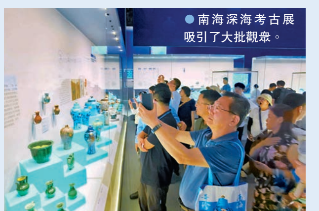
●南海深海考古展吸引了大批觀眾。