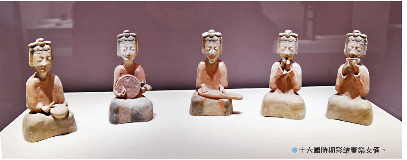
●十六國時期彩繪奏樂女俑。

斑斕多彩的三彩來通杯，繪有希臘酒神圖案的酒神駝囊駱駝，深邃神秘的仰韶文化彩陶盆，古樸凝重造型典雅的青銅鼎，完整的漢代樂隊俑，還有來自唐朝婉約如詩、婀娜多姿的「仕女」……日前，「探長安——西安市文物保護考古研究院30年考古成果展」在西安博物院開幕。作為西安市文物保護考古研究院建院30年來考古成果的一次集中展示，本次展覽共展出西安地區30餘個重要考古發現出土的280餘件(組)精品文物，其中大部分文物均為首次展出。特別是三彩來通杯等難得一見的珍貴絲路文物，更是一開展便吸引了大量的遊客前來打卡。展期至2025年5月。