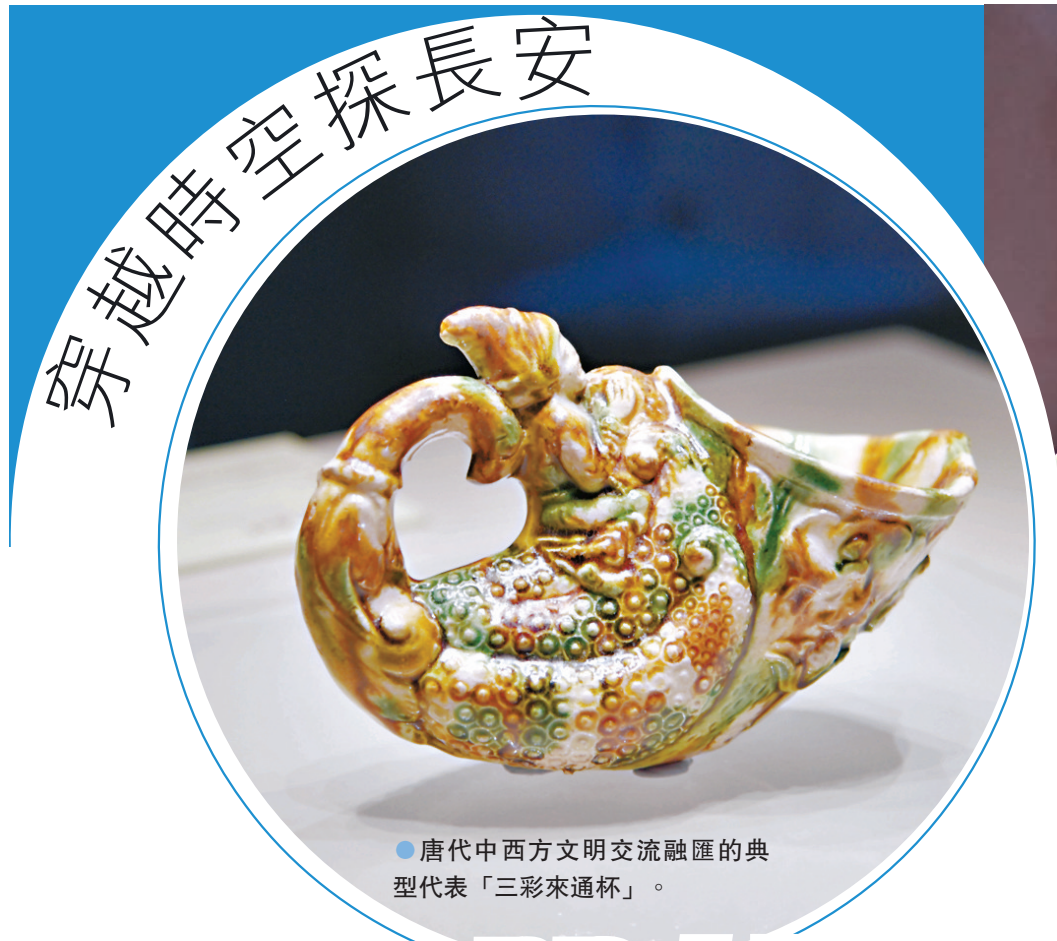
●唐代中西方文明交流融匯的典型代表「三彩來通杯」。