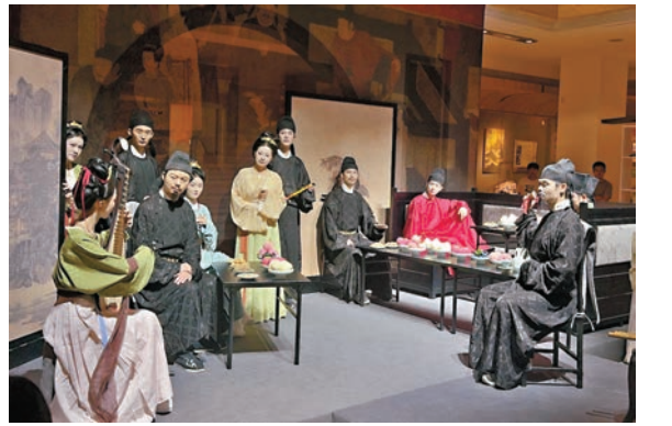
●展覽復刻了《韓熙載夜宴圖》中的場景。