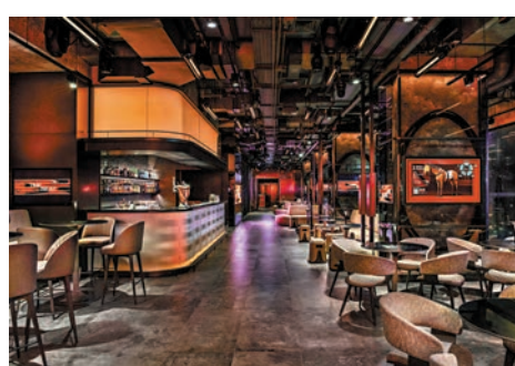
賓客可於酒吧隨時觀看實時賽馬影像。