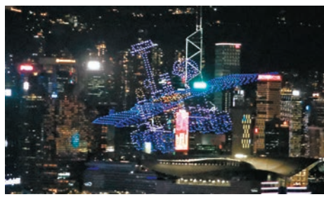
在餐廳裏，坐在窗邊座位，可以欣賞無人機表演。