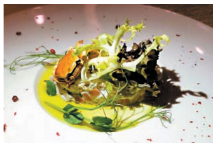
蟹肉他他·香葱油和海鮮雞尾醬汁

首先，在品嚐套餐前，職員先送來一籃內有三種口味的麵包，搭配橄欖油和香草醬；隨後的餐前菜是「日本磯煮鮑魚」，鮑魚口感清爽甜美，搭配濃郁的鮑魚肝醬。前菜有兩款選擇，一是「焦糖牛骨髓伴雞軟骨沙律、牛肝菌及牛他他配烤麵包和南瓜」，另一是「蟹肉他他、香葱油和海鮮雞尾醬汁」，這是淡淡的忌廉和鮮美的蟹肉，加上香