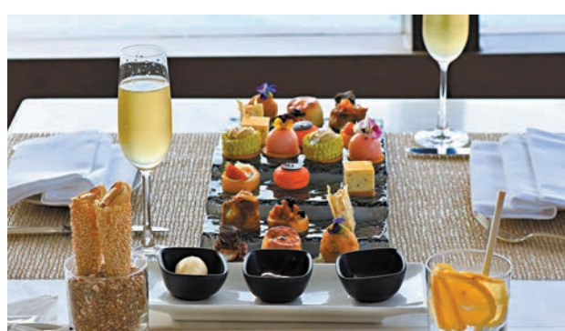
魚子醬·燕窩·黑松露·鴨肝·奢華下午茶

Le 188°餐廳也有下午茶餐，他們的下午茶「魚子醬·燕窩·黑松露·鴨肝·奢華下午茶」不似一些酒店甜點為主，現時女士怕胖喜歡鹹點多些，這個下午茶以魚子醬、燕窩、黑松露及鴨肝為主要食材，製作多款小食及甜點，未吃已覺得矜貴。精選小食上，有甜醬麵包配松露、牛肝菌、田螺配蛋黃醬、多士、香煎鴨肝、牛油麵包配芥末蜜餞醬、蔬菜撻配精選魚子醬、大西洋鱈魚、蝦丸配蒜蓉蛋黃醬；精選甜點方面，則有法式燕窩紅桑子馬卡龍、朱古力黑松露布甸、燕窩蒙布朗、芒果拿破崙及提子鬆餅、黑松露榛子泡芙。當然，下午茶還包括特選飲品的，大家可選即磨咖啡或茶，另外每位亦配送指定氣泡酒一杯。