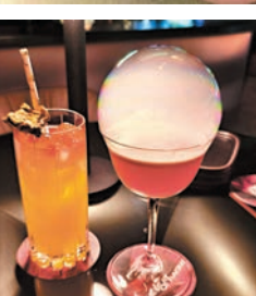
酒吧的創意雞尾酒色彩靚麗。