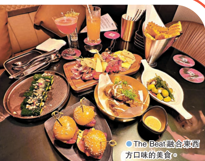
The Beat融合東西口味的美食。