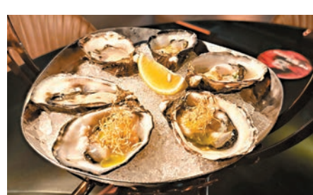
新鮮空運生蠔配柚子醬、薑蔥油及原味。

對外國人來講，賽馬活動是一種社交活動，而為吸引更多馬迷及旅客參與和觀賞賽馬活動，香港賽馬會現已開始在跑馬地馬場聯合看台樓二層試營The Beat酒吧，並於每周三營業。 這裏融合賽馬的刺激感與精緻派對的氣氛。踏入The Beat，巨型LED牆播放精彩賽事，引領賓客走入一個主題空間。室內的流暢線條設計透著現代風，燈光也充滿了氛圍感。訪客可於露台俯瞰整個馬場跑道的寬闊景致，觀看令人興奮的賽馬活動。 The Beat還升級數碼體驗和大數據使用技術分析數據，讓賓客透過科技參與投注。透過場內的互動屏幕，賓客可通過點選資料，觀看一比一的馬匹最新狀態虛擬動畫，還可實時獲得騎師和練馬師排行榜更新，掌握賽事動態。用戶體驗到的遊戲化元素，也將時尚賽馬帶到熱愛打機的新世代，提升並塑造嶄新的賽馬文化體驗，絕對是新的社交平台。 The Beat還有多樣化的美食和飲品，融合了東西方口味，如創意青瓜、橄欖拼盤等。這裏全年都有駐場樂隊及客席獨立音樂藝術家的現場表演，還有調酒師精心調製以冠軍名駒為設計靈感的多款原創雞尾酒。 ●文、攝：香港文匯報記者 兩竹