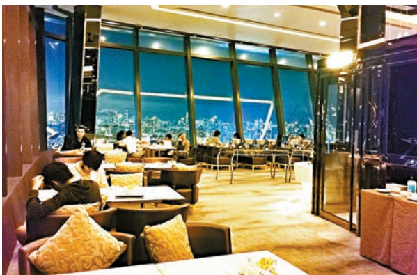
晚上，餐廳環境浪漫。

每當節慶，香港都少不了煙花或無人機表演，哪怕只是幻影詠香江，也令維港很美麗。如能邊吃邊舒服地欣賞就最開心不過，而建於維港兩岸的酒店自然是得到地利。在所到過的酒店中以位於北角的港島海逸君綽酒店頂樓的Le 188°餐廳及酒廊的日夜景色之美最令人難忘，難怪獲評為「世一靚景打卡餐廳的票王」。其設有三面偌大的落地玻璃熒幕，以188度展現維港美景，讓大家飽覽維港兩岸無敵景致。記者日前到餐廳品嚐其全新的五道菜晚市套餐，就碰巧看見無人機在試飛，係意外驚喜，有片為證。在下午茶的時候你安坐在任何角落，