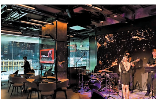
酒吧全年都有駐場樂隊及客席獨立音樂藝術家的現場表演。