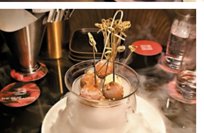
榛子雪糕、紅莓雪葩及櫻桃白蘭地雪糕。