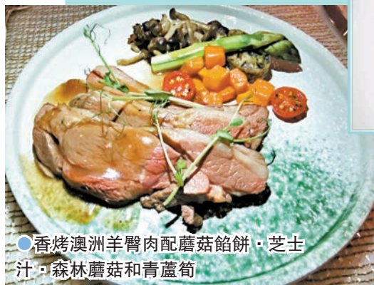
香烤澳洲羊腩肉配蘑菇餡餅、芝士汁、森林蘑菇和青蘆筍