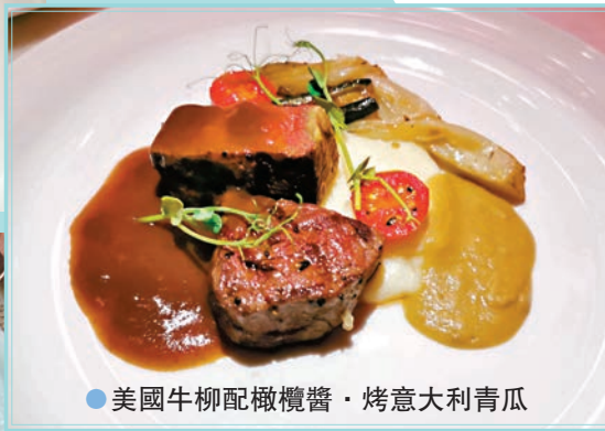
美國牛柳配橄欖醬、烤意大利青瓜