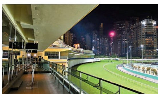
訪客可於露台俯瞰馬場跑道的寬闊景致。