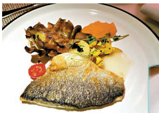
地中海鯛魚配粟米餅、野菌和青蘋果醬