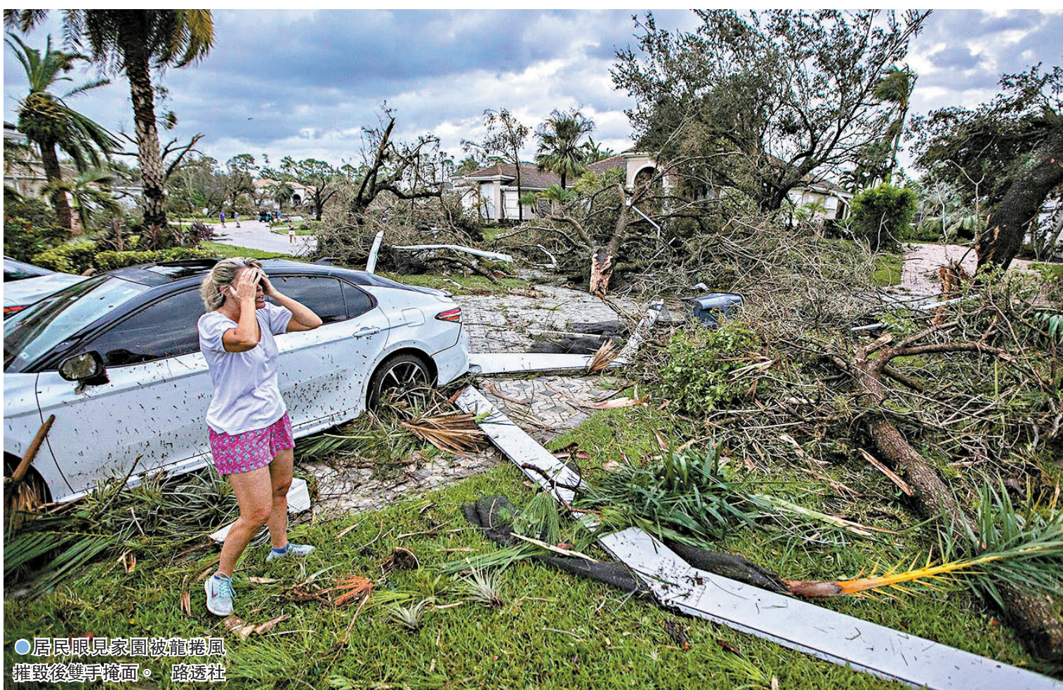
● 居民眼見家園被龍捲風摧毀後雙手掩面。