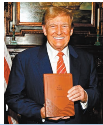
● 特朗普為鄉村音樂歌手格林伍德推出的《天佑美國聖經》背書。

特朗普3月宣布，為美國鄉村音樂歌手格林伍德推出的《天佑美國聖經》背書。這個版本的《聖經》以格林伍德本人的同名愛國歌曲為靈感，除了收錄英王欽定版《聖經》以外，還附有《天佑美國》歌詞，以及美國《憲法》、《獨立宣言》、《權利法案》和「效忠美國誓詞」。