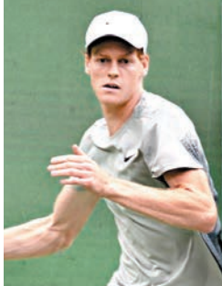
●辛拿再過一關。

至於上海網球大師賽，10日首場8強戰由辛拿對陣梅德韋傑夫，面對今年格外強勢的辛拿，梅德韋傑夫以1：6、4：6落敗。辛拿賽後對自己的表現表示滿意，「他似乎肩膀受傷，所以沒打出最好水平，特別是在反手。但受傷在比賽中在所難免，我抓住了機會。」對於網壇傳奇拿度宣布退役，辛拿直言，「這對我們所有人都是個令人遺憾的消息。」他稱自己很幸運能認識拿度，能見證拿度的優秀，並從對方身上學習到很多。