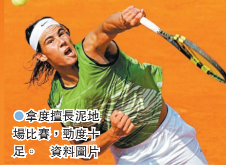
●拿度擅長泥地場比賽，韌度十足。資料圖片