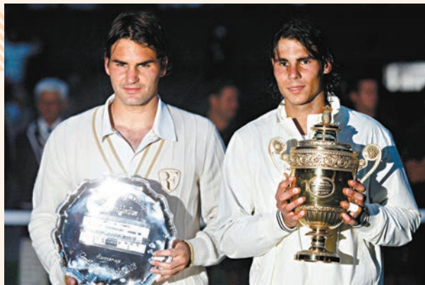
●拿度(右)與費達拿合演了2008年溫網的一場經典對決。

作為拿度最偉大的對手，費達拿亦在社交媒體上送上祝福：「真是一場精彩的征程，我一直希望這（拿度退役）一天永遠不會到來，感謝你在我們熱愛的這項運動中留下的難忘回憶和令人難以置信的成就。這絕對是榮幸。」