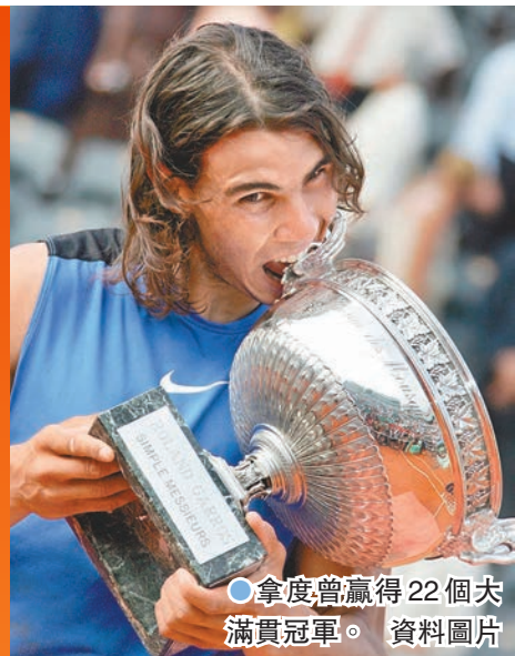
●拿度曾贏得22個大滿貫冠軍。