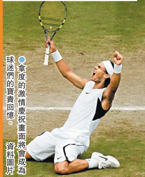
●拿度的激情慶祝畫面將會成為球迷們的寶貴回憶。

有「泥地王」之稱的西班牙網球名將拿度昨日宣布，將會在這個賽季結束後退役。擁有22個大滿貫賽事冠軍的他近年飽受傷患困擾，最後終於決定在今年11月代表西班牙戰罷台維斯盃後，跟隨老對手費達拿的步伐高掛球拍，這亦意味着近20年主宰網球壇男子賽場的「三巨頭」，將會只餘下祖高域仍在賽場奮戰。