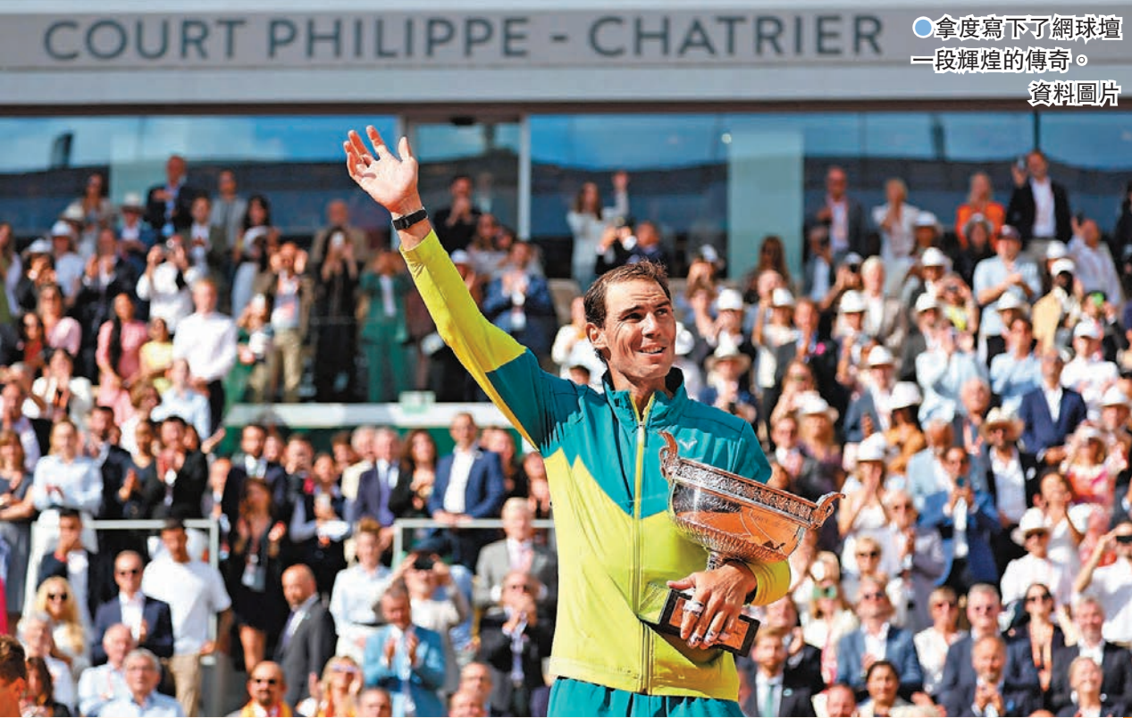
●拿度寫下了網壇一段輝煌的傳奇。

雖然拿度擅長泥地場作戰，但在硬地場與草地場亦曾數度令老對手費達拿陷於苦戰。2008年溫網決賽，