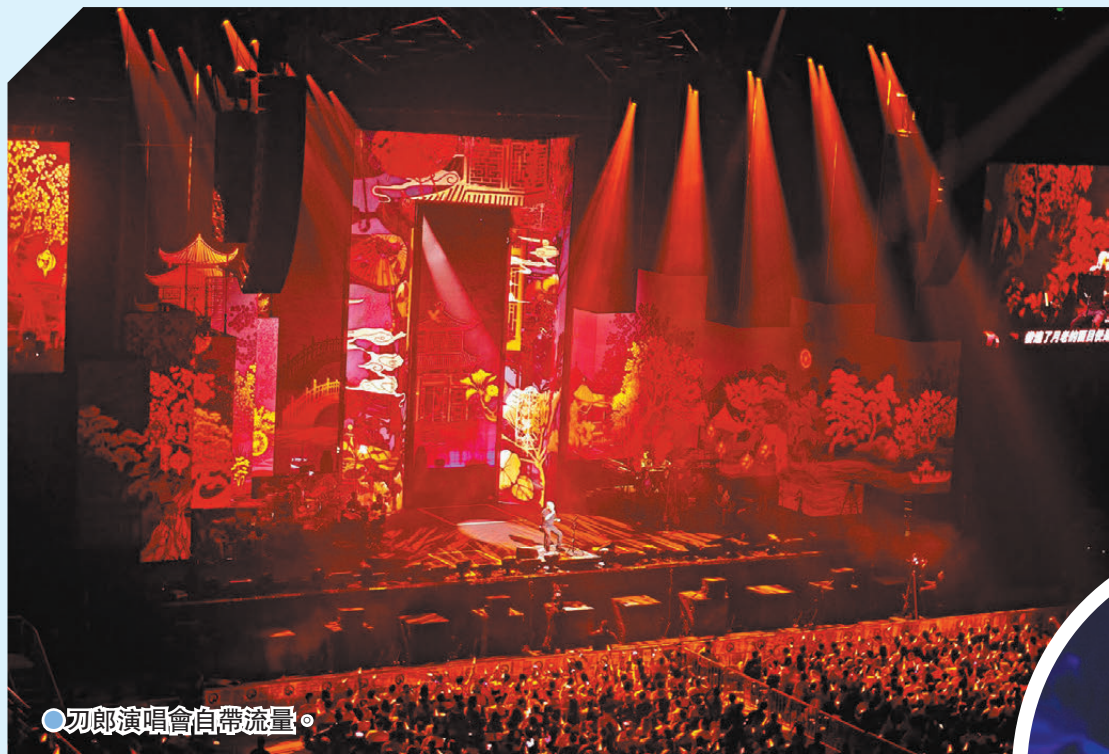
刀郎演唱會自帶流量。

香港文匯報訊（記者 陳旻 南京報道）「山歌響起的地方·刀郎2024巡迴演唱會南京站」於10月12日與13日晚在南京青奧體育公園體育館舉行。昨日有大量外地歌迷興沖沖地奔赴南京，他們提前到南京青奧體育公園體育館「踩點」，拍攝視頻或做直播相發布於社交媒體，以此吸引粉絲、增加流量。演唱會帶動經濟，南京當地文旅商早早做足配套準備，聯動場館周邊商圈、酒店，紛紛公布一系列方便歌迷住宿、放鬆休閒購物的舉措。