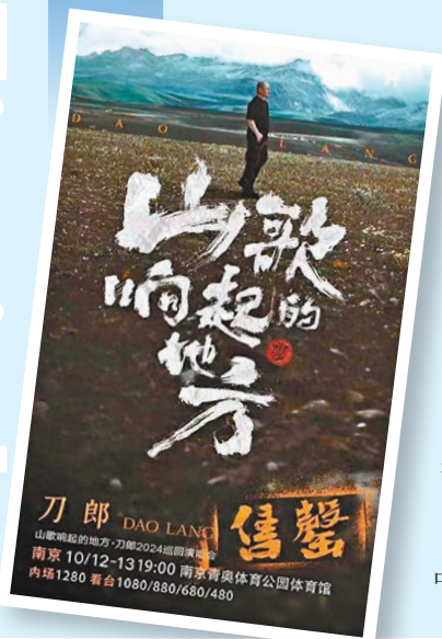
刀郎南京騷一票難求。

此外，在演出期間，周邊不僅將開設品牌餐飲，月牙廣場上還將備有美食餐車市集可供選擇，沿途為歌迷們提供蛋仔霜淇淋、熱狗、蚵仔煎等精美小吃。南京商家早早宣傳承諾將貼心服務，使歌迷沉浸於刀郎魅力的同時，全方位感受南京的城市熱度。