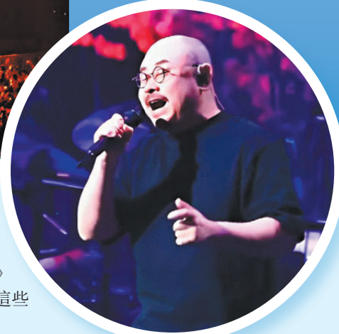
刀郎的歌聲餘音繞樑。