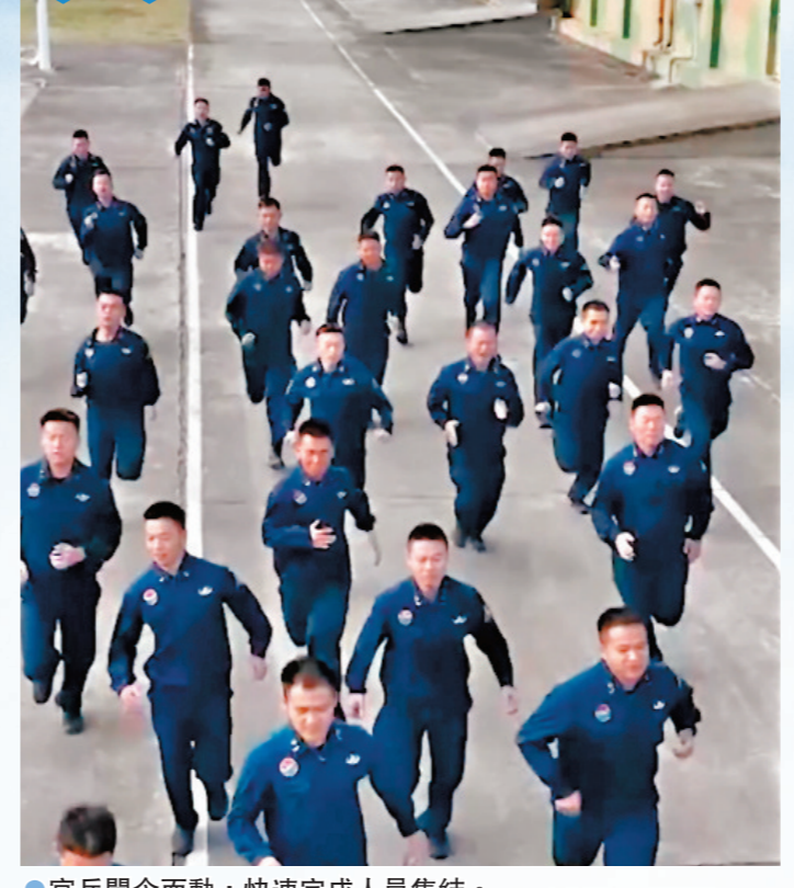
官兵聞令而動，快速完成人員集結。