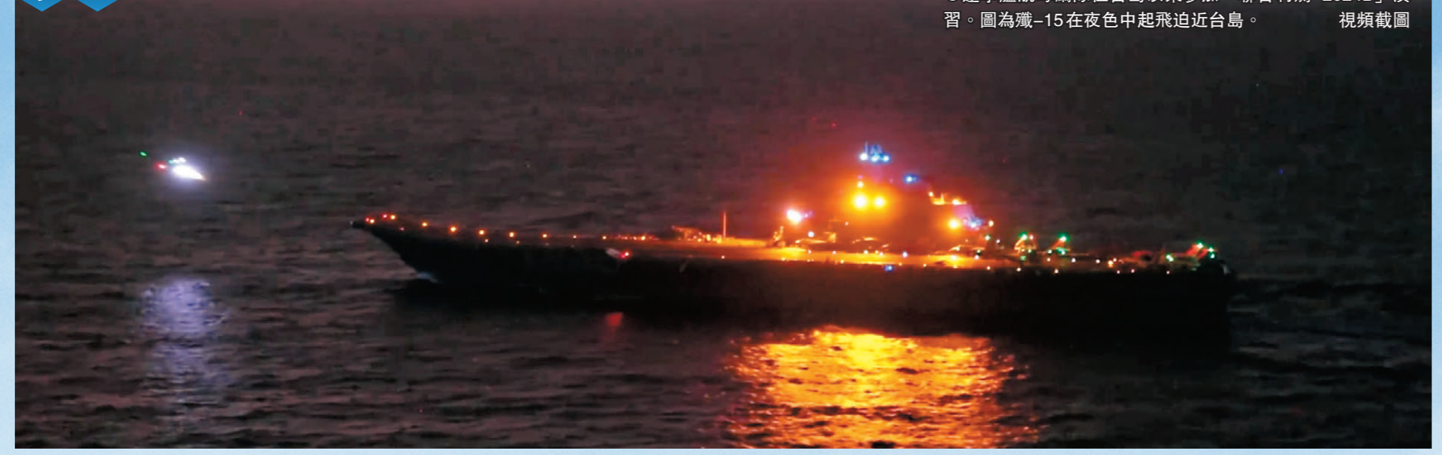
遼寧艦航母編隊位台島以東參加「聯合利劍-2024B」演習。圖為殲-15在夜色中起飛迫近台島。視頻截圖