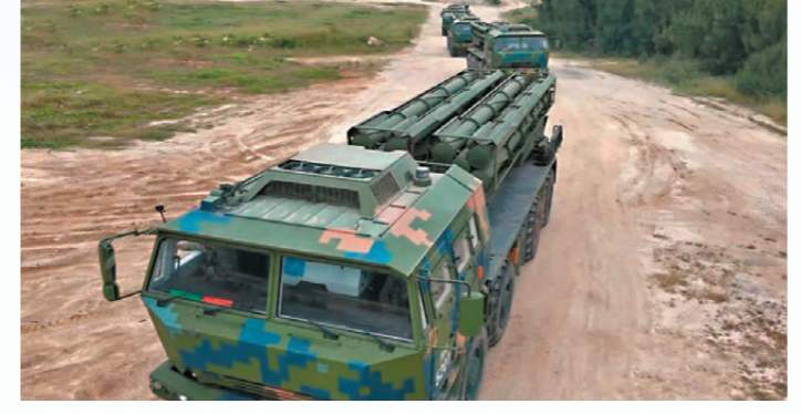
陸軍某遠程箱式火箭炮分隊聞令而動。