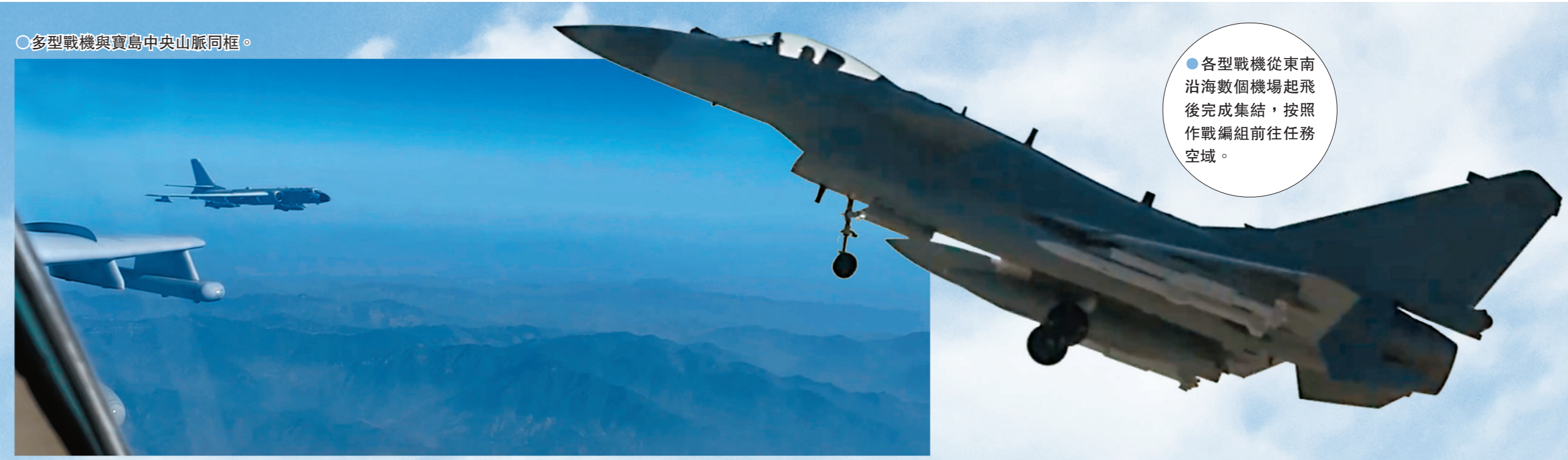
多型戰機與寶島中央山脈同框。

14日傍晚，東部戰區新聞發言人李熹海軍大校宣布，中國人民解放軍東部戰區圓滿完成「聯合利劍-2024B」演習各項科目，全面檢驗了戰區部隊一體化聯合作戰能力。戰區部隊時刻保持高度戒備，持續加強練兵備戰，堅決挫敗「台獨」分裂行徑。