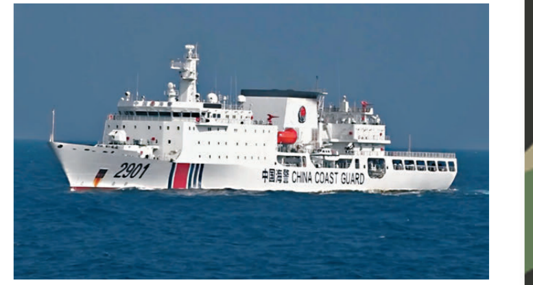
海警2901號萬噸艦首次參加對台任務。