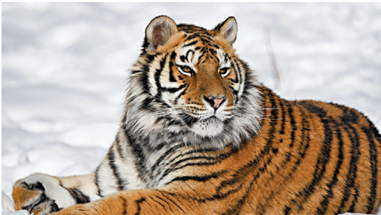
●萬興富拍攝的國家一級保護野生動物——東北虎。