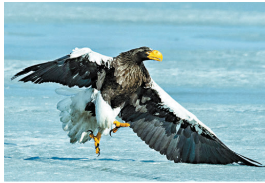
●萬興富拍攝的國家一級保護野生動物——虎頭海雕。