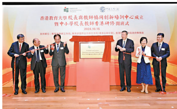
●教大昨日成立校長與教師協創新培訓中心，並舉行中小學校長教師研習班開班式。

另一連鎖傢具用品店IKEA宜家家居亦借事件「抽水」，昨日下午在其社交平台以藍底黃字「多謝各位多年支持」發帖回應，但寫明「小編先唔會扮結業呀」，指其公司的產品早已是創新低價，即「突破新價」，並感謝消費者的支持。