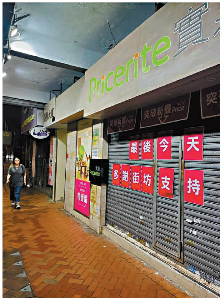
●多間Pricerite實惠分店於前晚關門拉開時，均貼有寫上「最後今天多謝街坊支持」大字報，令結業揣測更「似層層」。圖為Pricerite實惠太子分店。

在環球經濟不明朗下，香港的零售消費市場雖自疫後逐漸復甦，但仍偶有出現連鎖店結業事件。全港共有十多間分店的連鎖傢具用品店Pricerite實惠，昨日凌晨在社交平台以「多謝各位多年支持」發帖，卻並無任何說明，即時惹來網民熱議，以為又一連鎖店結業，員工更成驚弓之鳥。Pricerite實惠昨晨揭開謎團，以「舊有原價已成過去；今天開始突破新價」為題發新帖，始令大眾得知原來是上一輪優惠結束，緊接推出新一輪優惠的宣傳手法。大批網民留言鬧爆其宣傳手法，批評是在欺騙消費者及玩弄港人情緒，亦有網民表明再無信心光顧其公司，甚至有人指即使他日要結業亦「唔抵可憐」。