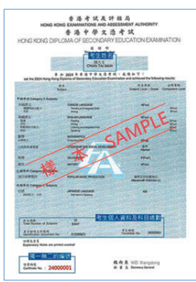
●DSE證書樣本 考評局圖片

是重要的資歷憑證，故收到證書後應仔細核對。考評局表示，如有資料需要更正，考生可於今年12月31日或之前，把證書與填妥的更正資料申請表格一併交回考評局，費用全免；若於明年1月1日至3月31日期間提出更正申請，須繳交286元。若遺失證書或要求在明年3月31日以後更改個人資料，可向考評局申請成績證明書，現時為每張568元。 由於證書只會於考試當年向考生印發一次，上面印有獨立的證書編號及時任秘書長的簽名，每張均獨一無二，就算遺失亦不能補領，考生只可以申請成績證明文件，詳情可瀏覽考評局網頁。若有其他疑問，可聯絡公開考試資訊中心熱線3628 8860或電郵至dse@hkeaa.edu.hk。