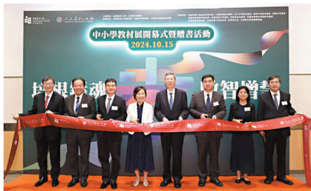
●教大及人民教育出版社主辦「培根鑄魂 啟智增慧——中小學教材展開幕暨贈書活動」。