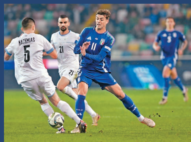
●司職中場的丹尼爾馬甸尼(右,11號)後備入替，完成了個人的意大利國家隊首演。