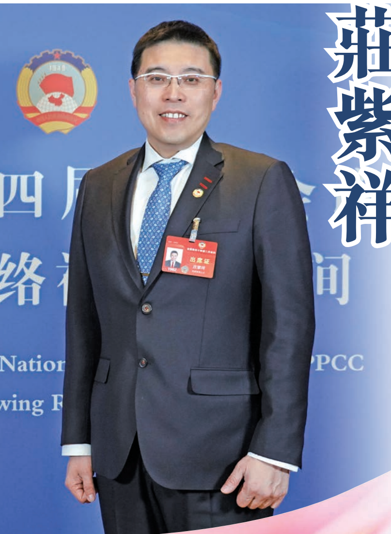
●3月，莊紫祥出席2024年全國兩會。