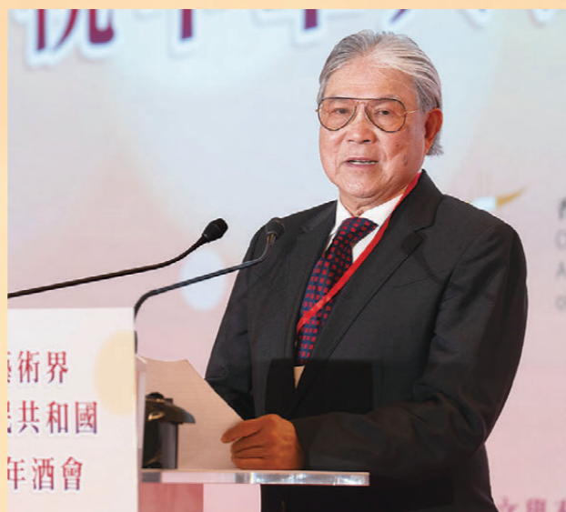
●霍震霆指出慶祝活動促進文化交流共融。

由香港文化藝術界慶祝籌備委員會舉辦的香港文化藝術界慶祝中華人民共和國成立75周年酒會日前（7日）在香港 JW 萬豪酒店圓滿舉行。行政長官李家超，中央政府駐港聯絡辦秘書長王松苗，外交部駐港特派員公署副特派員李永勝，立法會主席梁君彥，文化體育及旅遊局署理局長劉震，紫荊文化集團董事長許正中，中央政府駐港聯絡辦宣傳文體部副部長李曙光，全國人大常委、立法會議員李慧琼，全國政協常委、西九文化區管理局董事局主席唐英年，香港文聯會長、立法會議員馬逢國，香港藝術發展局主席、籌委會秘書長霍啟剛等應邀出席，在籌委會榮譽贊助人、大會發起人、聯席主席霍震霆及區永熙陪同下共同主禮，與現場一眾本地文藝界精英翹楚及各界友好歡聚一堂，為祖國華誕送上誠摯祝福。