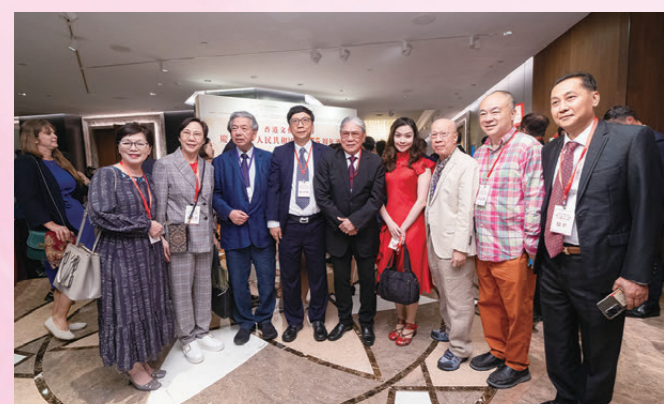
●區永熙（左四）霍震霆（左五）與戲劇界代表同賀國慶。