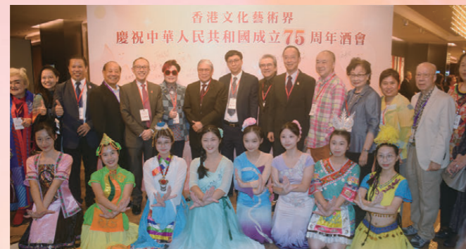
●後排：吳壽南（左四）、毛俊輝（左五）、陳淑芬（左六）、霍震霆（左七）、區永熙（左八）、姜大衛（左九）、馬逢國（左十）、高志森（左十一）、何真平（左十二）與影視、劇曲界友好共賀國慶。