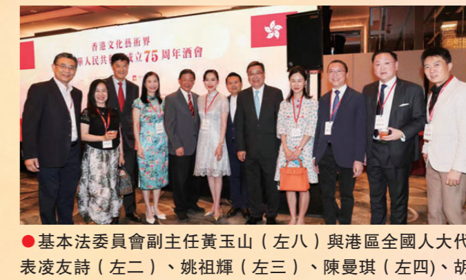
●基本法委員會副主任黃玉山（左八）與港區全國人大代表凌友詩（左二）、姚祖輝（左三）、陳曼琪（左四）、胡曉明（左五）、鄺美雲（左六）、陳勇（左七）、林至穎（左十）、孫偉勇（左十一）等出席香港文化藝術界慶祝國慶75周年酒會。