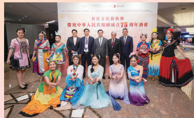
●後排左四起：霍啟剛、區永熙、李家超、霍震霆、劉震與穿著少數民族服飾的少女合照。