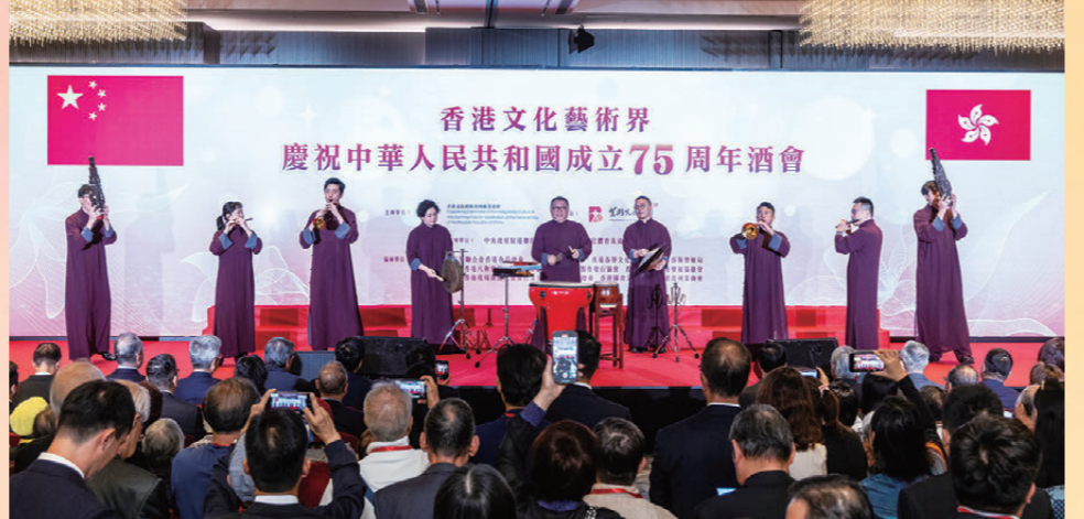
●香港中樂團敲鑼慶賀國慶。

霍震霆在歡迎辭中指出，香港文化藝術界慶祝國慶活動自1999年創辦至今已25年，一直獲得香港特區政府、中央駐港機構領導、多國駐港領事館領事及香港文化藝術界菁英的踴躍出席和高度讚譽。新中國成立75年來，全國各族人民同心同德，艱苦奮鬥，這種堅毅卓越的情操，也感染了香港文藝界同仁，矢志以不懈努力，為實現國家「十四五」規劃明確支持香港發展成為中外文化藝術交流中心的決定，積極貢獻業界的智慧和力量。