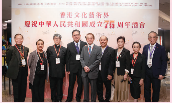
●音樂、舞蹈界代表及友好共賀國慶。