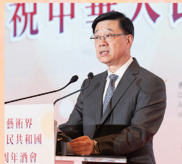
●李家超致辭時表示香港享有中西文化薈萃獨特優勢。