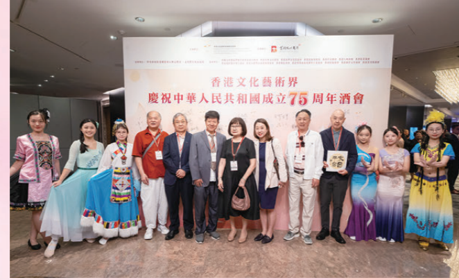
●書畫界精英出席酒會祝賀。