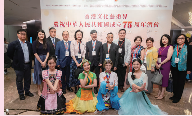
●出版、書畫界與朋友齊賀國慶。