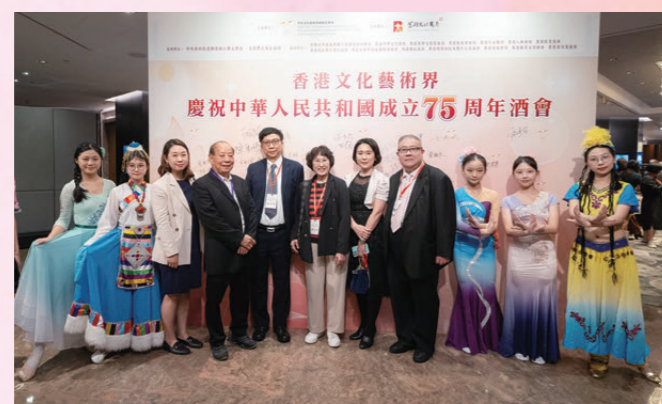
●影視界嘉賓出席酒會祝賀國慶75周年。

由香港文化藝術界慶祝籌備委員會舉辦的香港文化藝術界慶祝中華人民共和國成立75周年酒會日前（7日）在香港 JW 萬豪酒店圓滿舉行。行政長官李家超，中央政府駐港聯絡辦秘書長王松苗，外交部駐港特派員公署副特派員李永勝，立法會主席梁君彥，文化體育及旅遊局署理局長劉震，紫荊文化集團董事長許正中，中央政府駐港聯絡辦宣傳文體部副部長李曙光，全國人大常委、立法會議員李慧琼，全國政協常委、西九文化區管理局董事局主席唐英年，香港文聯會長、立法會議員馬逢國，香港藝術發展局主席、籌委會秘書長霍啟剛等應邀出席，在籌委會榮譽贊助人、大會發起人、聯席主席霍震霆及區永熙陪同下共同主禮，與現場一眾本地文藝界精英翹楚及各界友好歡聚一堂，為祖國華誕送上誠摯祝福。