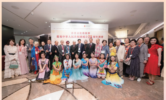
●酒會發起人和一眾文化藝術界精英與穿著少數民族服飾的少女合照。