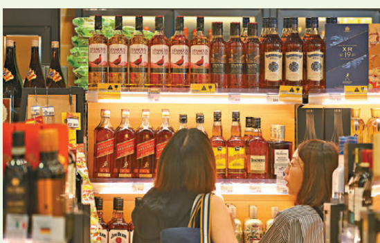
●李家超表示，下調高端烈酒稅率，主要目的是推動貿易。

出口作為推動本港經濟「三頭馬車」之一，新一份施政報告提出下調高端烈酒稅率，以促進烈酒貿易，並期望帶動物流、儲庫、旅遊、高端餐飲消費等高增值產業發展。特區行政長官李家超昨日在專訪中表示，特區政府此舉的最主要目的是推動貿易，而非推動飲用。他強調，在考慮如何推動貿易時，要先衡量哪些最易推動及哪些已推動，「我們分析過烈酒，它可以成為真真正正最大回報的貿易。」