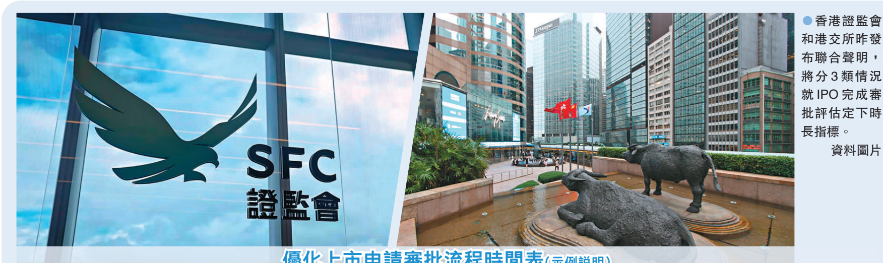
優化上市申請審批流程時間表(示例說明)

財庫局局長許正宇昨表示，上述優化新上市申請審批流程時間表的公布，落實本週施政報告提出優化證券市場的一項重要措施。他認為，優化時間表為發行人及其企業融資服務機構提供更大確定性，進一步鞏固香港作為全球IPO首發集資中心的地位。承接今年較早前中國證監會公布支持內地行業龍頭企業赴港上市，這次優化為香港IPO市場增長再添動力，便利更多具長遠發展和回報潛力的企業來港上市。