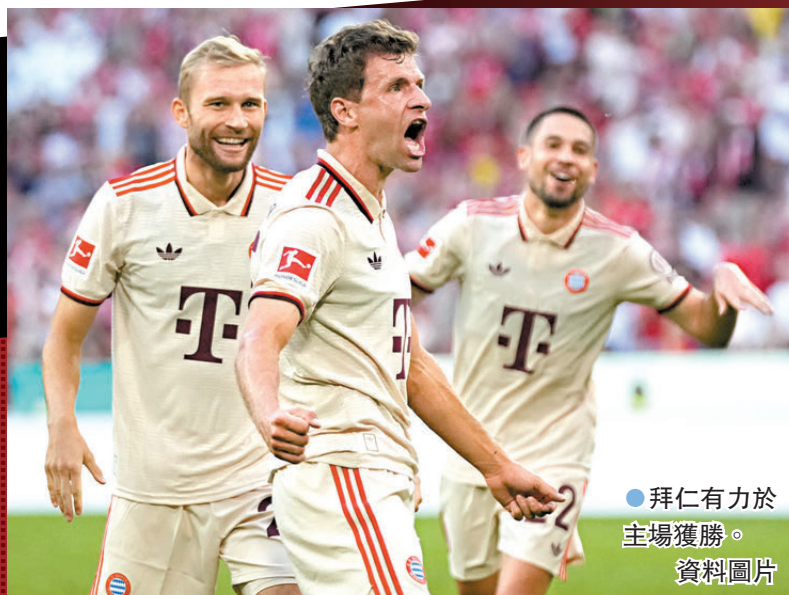
●拜仁有力於主場獲勝。資料圖片