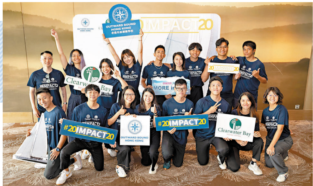
●來自不同背景的20名參加者將在為期一個月的航行中齊心協力克服難關。大會圖片

本屆射擊世界盃總決賽已經落幕，在12個單項的比拼中，中國隊奪得5金3銅。意大利、德國、法國、匈牙利、丹麥、聖馬力諾和美國隊各得1金。