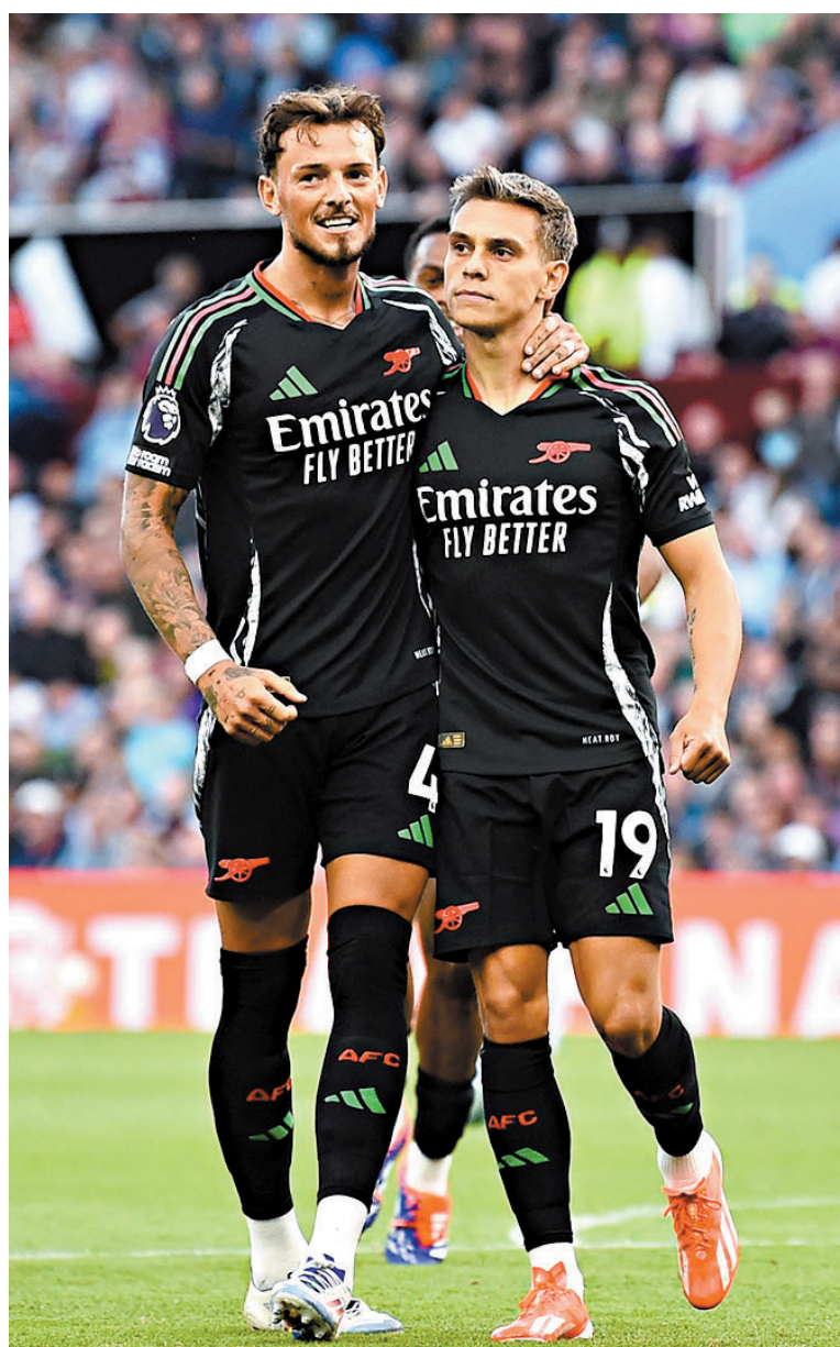
●阿仙奴有力再度取得勝仗。