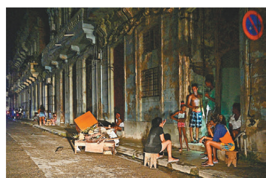
民眾晚上在街上聊天乘涼。

能源部負責電力供應的首長蓋拉宣布，島上8座老舊燃煤發電廠中最大的吉特拉斯熱電廠無預警停機。這次大停電發生前，古巴部分省份已經連續數周每天停電長達20小時，促使當局在周四宣布國家進入「能源緊急狀態」。這場危機已經迫使官員取消所有非必要的政府服務，從小學到大學的所有學校將持續關閉至周日。包括夜店在內的娛樂和文化活動也被下令暫停，以優先保障家庭用電。