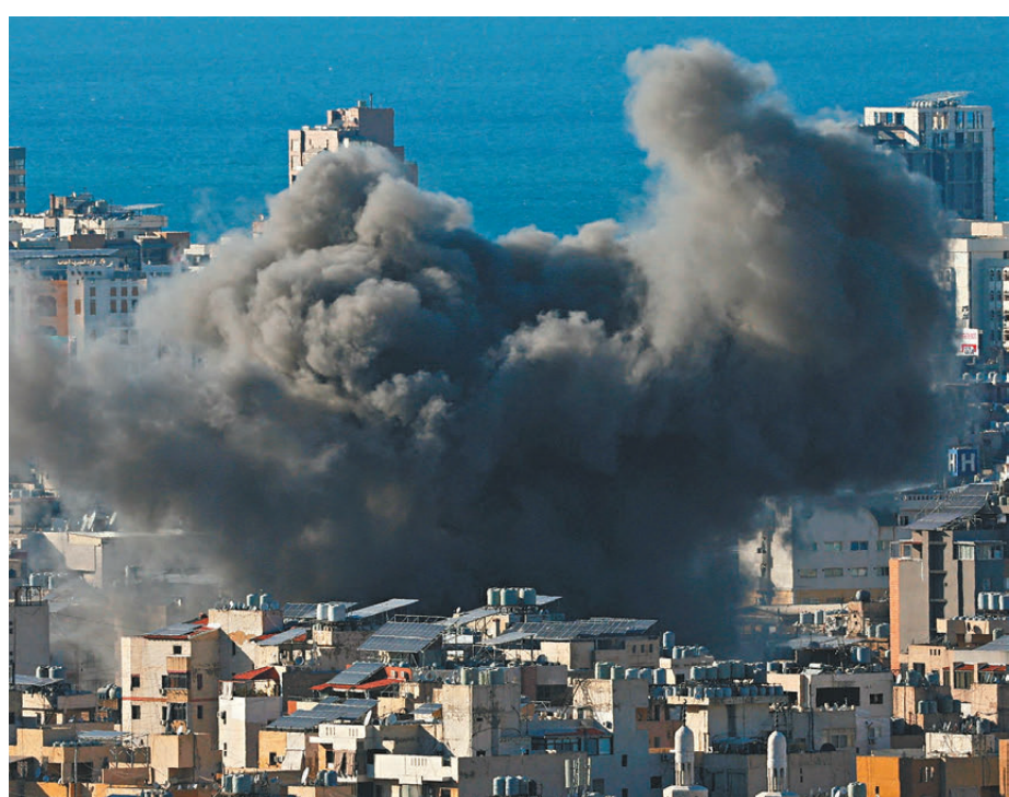
以軍持續轟炸黎巴嫩首都貝魯特。

然而巴勒斯坦與聯合國機構也擔憂，以色列疑似是想要透過此舉，將加沙北部與其他地區隔離，試圖封鎖該地區，藉此徹底阻止哈馬斯在加沙北部的活動。此外以色列更考慮對伊朗10月1日