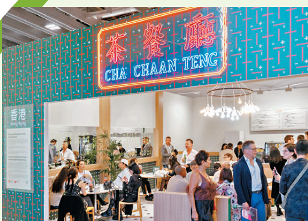
●旅發局於巴黎大皇宮內設立「茶餐廳」，展現香港特色文化。

另外，局方正全力籌劃明年3月28日至30日舉行的巴塞爾藝術展香港展期間，呈獻精彩活動。