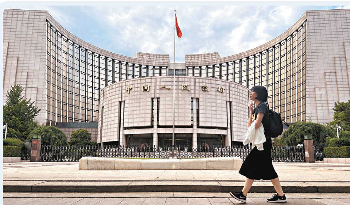
●人行今日將下調LPR，A股或將進入「牛市拉鋸戰」階段。圖為人行總部。