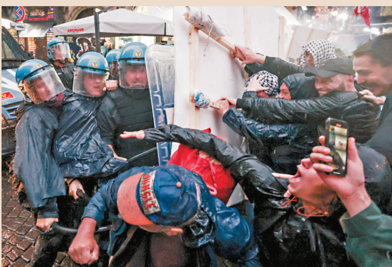
●那不勒斯舉行反G7遊行,示威者與警方發生衝突。

美國防長奧斯汀在參加會議時則表示,美國希望以色列「減少對貝魯特及其周邊地區的襲擊」。他說,希望看到局勢朝着談判的方向發展,讓(黎以)邊境兩側的平民能夠重返家園。意大利防長克羅塞托在會後呼籲加沙立即停火,釋放所有被扣