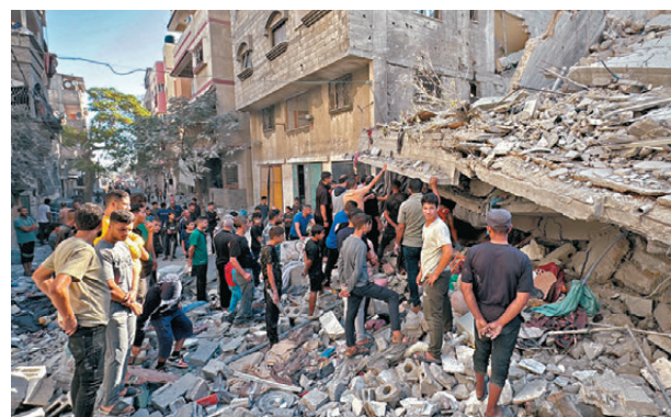
●民眾在加沙北部平民區進行搜救。