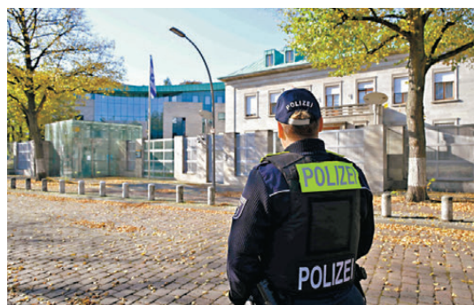
●警員在駐德大使館附近巡查。

以色列駐柏林大使普洛瑟在社媒發文,感謝德國當局「確保以色列大使館的安全」。以駐哥本哈根和斯德哥爾摩大使館於10月初均曾受到攻擊。