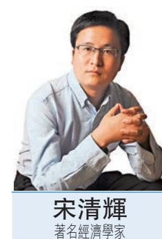
宋清輝 著名經濟學家