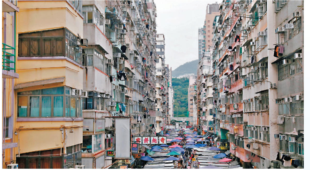
●舊區劏房林立，但需要改裝的只佔少數，且一般只需小型工程。

香港社會關注就「簡樸房」立法後，現有劏房業主或會將單位改裝成本轉嫁至租戶身上。香港特區政府房屋局局長何永賢昨日表示，需要改裝的劏房只佔少數，且如只屬加裝消防感應器、滅火筒及水電錶等小型工程，合共只需數千元，加上屆時劏房需求將隨大批租戶已成功上樓而大幅減少，相信租金沒有大幅上升的空間。她呼籲業主於立法後盡早為劏房登記，符合「簡樸房」要求的單位可短時間內獲發認證並於網上公開，供有需要市民租住，特區政府會就認證制度設覆核審查，以免有人「檢驗做唔齊」，初步建議每隔5年再認證一次。