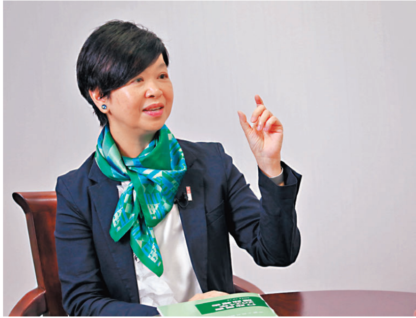
●何永賢表示，「簡樸房」認證制度設覆核審查，初步建議每隔5年再認證一次。

香港社會關注就「簡樸房」立法後，現有劏房業主或會將單位改裝成本轉嫁至租戶身上。香港特區政府房屋局局長何永賢昨日表示，需要改裝的劏房只佔少數，且如只屬加裝消防感應器、滅火筒及水電錶等小型工程，合共只需數千元，加上屆時劏房需求將隨大批租戶已成功上樓而大幅減少，相信租金沒有大幅上升的空間。她呼籲業主於立法後盡早為劏房登記，符合「簡樸房」要求的單位可短時間內獲發認證並於網上公開，供有需要市民租住，特區政府會就認證制度設覆核審查，以免有人「檢驗做唔齊」，初步建議每隔5年再認證一次。