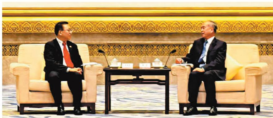
▲山東省委書記林武（右）會見崔建春（左）。

此次參訪活動主題是「走進山東，助力魯港高水平合作」。按照行程，21日至27日，外國駐港領團和商界山東參訪團將赴濟南、濟寧、泰安、威海、煙台、青島等地參觀訪問，考察當地重點產業園區和代表性企業，並與當地政府負責人進行交流。