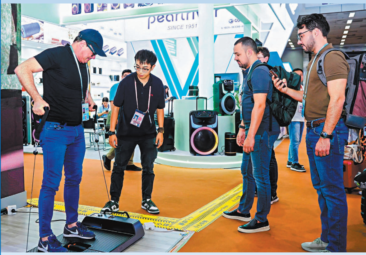
●境外採購商體驗視源股份交互功能的健身器材。