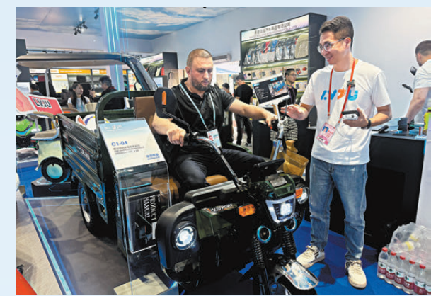
●10月17日，海外採購商「試駕」國產「三蹦子」。

「中國的發展，世界的機遇。面向未來，我們將繼續與國際社會共享巨大市場潛力、蓬勃創新活力、強勁發展紅利，以中國經濟的確定性為世界經濟注入更多穩定性。」林劍說。